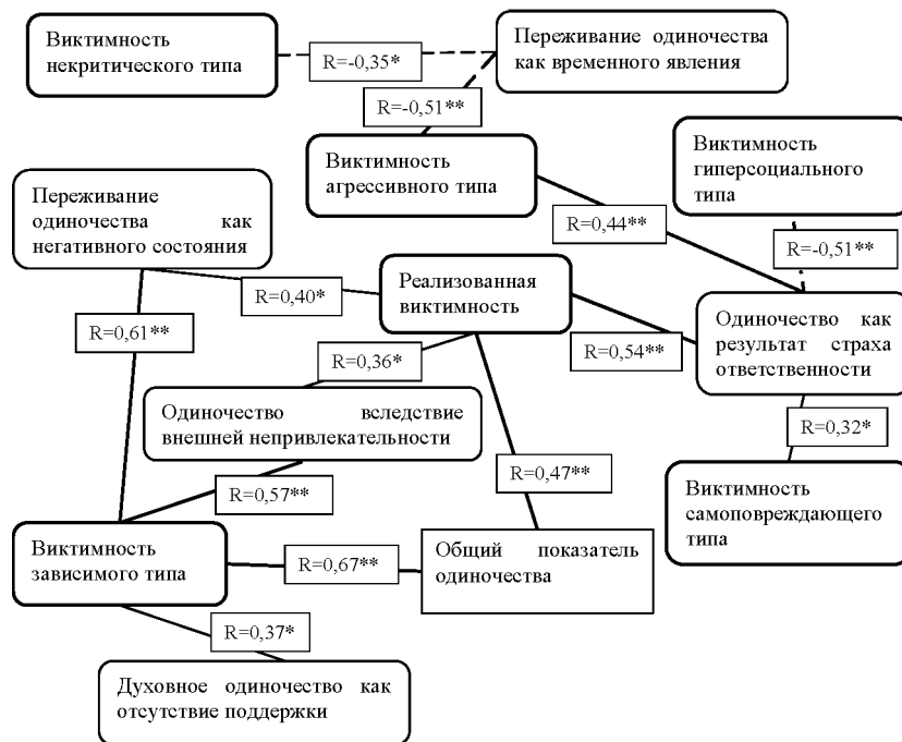
Рис. 4. Корреляционная плеяда взаимосвязи субъективного переживания одиночества и склонности к виктимности по методике Е. А. Манаковой

Для выявления специфики взаимосвязи между различными по содержанию типами переживания одиночества подростков с виктимным поведением была использована дополнительная диагностическая методика Е. А. Манаковой. Корреляционная плеяда представлена на рисунке 4.