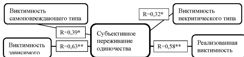
Рис. 3. Корреляционная плеяда взаимосвязи субъективного переживания одиночества и склонности к виктимности по методике Рассела – Фергюсона

Примечание: ——— прямая взаимосвязь * – p \leq 0,05 ; ——— прямая взаимосвязь ** – p \leq 0,01 .