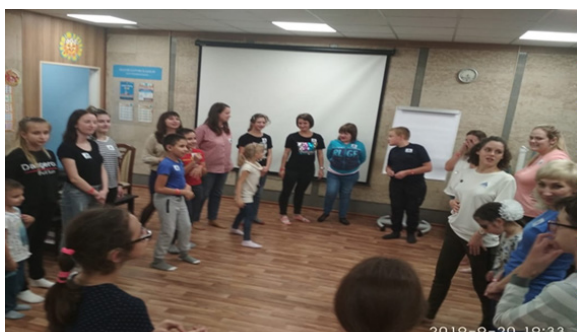
Рис. 6. Лагерь выходного дня для детей с ОВЗ

Многие родители отметили, что с момента рождения детей они ни разу не отлучались от детей на долгое время. Некоторые из семей никогда не получали квалифицированной помощи специалистов. Семьи детей с ограниченными возможностями здоровья утверждают, что получили хорошую разгрузку и обрели много полезных знакомств.