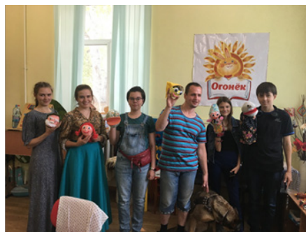
Рис. 16. Актеры «Театра, доступного всем»