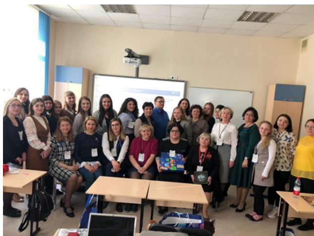
Рис. 10. «Наставники и Ученики» в НГПУ (2019)

Конференция помогла установить контакты между учеными и практиками различных регионов России и зарубежных стран по вопросам психолого-педагогического сопровождения лиц с тяжелыми множественными нарушениями, в ней приняли участие специалисты из России, Франции, Италии, Хорватии. В рамках конференции состоялась серия мастер-классов, на которых специалисты получили практические навыки работы со слепоглухими детьми. Иностранные гости посетили детский сад для глухих детей в Новосибирске и ресурсный центр «Со-творение», познакомившись с современными практиками работы со слепоглухими детьми и взрослыми в России. Участники театральной студии «Школа. Инклюзион. Новосибирск» и профессиональные актеры новосибирских театров показали гостям трогательную историю о маленьком человечке – инклюзивный спектакль «Юшка», созданный по одноименному произведению А. Платонова.