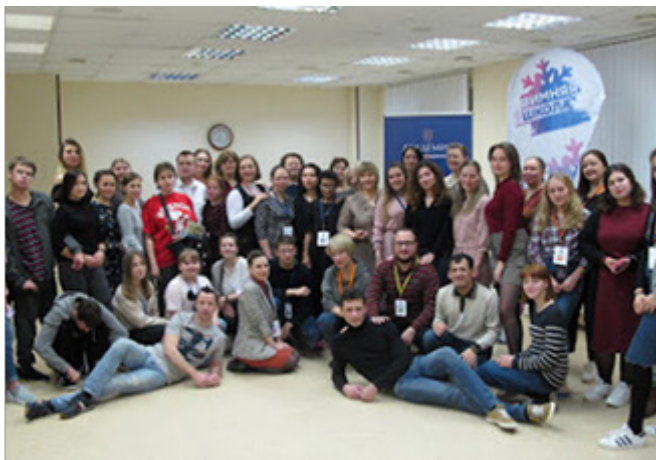
Рис. 18. Зимняя школа волонтеров (2020). Это бесценный опыт оказания поддержки слепоглухим, их семьям

Каждый год студенты разных направлений и факультетов НГПУ, других вузов и образовательных организаций, учреждений соцзащиты,