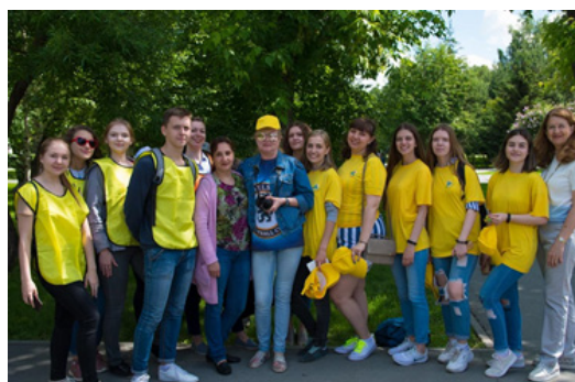
Рис. 2. Команда волонтеров Фестиваля по спортивному ориентированию «Пирамида» и соревнования для людей с нарушением зрения

Организован фестиваль по инициативе Новосибирской межрегиональной общественной организации инвалидов «Ассоциация “Интеграция”». Наши студенты также стали участниками мероприятия, приняв участие в качестве волонтеров, направляющих участников соревнования (рис. 2).