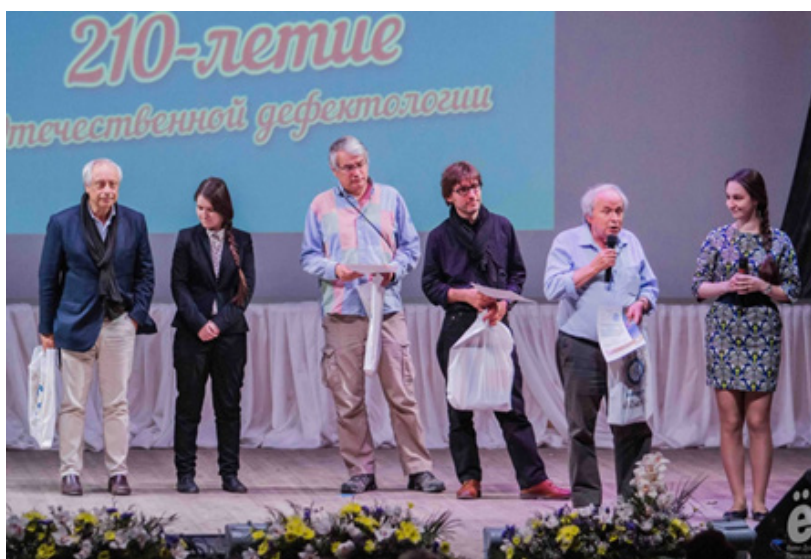
Рис 6. Слева направо: Родригес Давид, профессор, Университет Лиссабона, Португалия; Аршамбо Доминик, профессор Университета Париж-8, Франция; Моро Седрик, профессор INS NEA; Саго Жак, профессор, Университет Париж-8, Франция – участники XIV традиционного эвристического проекта «День дефектологии. Дефектология как фундамент равных возможностей» в рамках Международного форума «Пространство равных возможностей в XXI веке», посвящённого 210-летию отечественной дефектологии (27 апреля 2017 г.)

Сложившимся сегодня зарубежным связям представителей специального и инклюзивного образования мы обязаны Геннадию Сергеевичу. По его инициативе в Новосибирске часто бывали Жак Саго, Доминик Оршамбо, Сильвио Пальяра, Седрик Моро и другие известные люди, которые приезжали из разных уголков планеты на семинары, курсы, конференции, форумы (рис. 6).