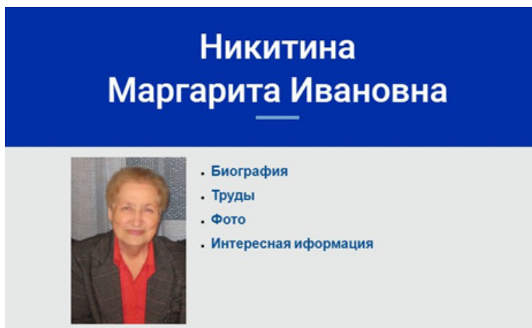
Рис. 2. Страница М. И. Никитиной на сайте

Проиллюстрируем наполнение сайта на примере одного из великих сурдопедагогов современности Маргариты Ивановны Никитиной (рис. 2).