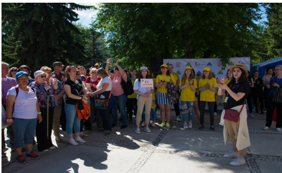
Рис. 1. Фестиваль по спортивному ориентированию «Пирамида» и соревнования для людей с нарушением зрения

20 июня 2019 г. в Новосибирске состоялся фестиваль по спортивному ориентированию «Пирамида» и соревнования для людей с нарушением зрения (рис. 1).