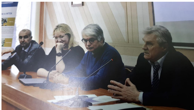
Рис. 9. Научно-практический семинар в Институте детства НГПУ (2019 г.)