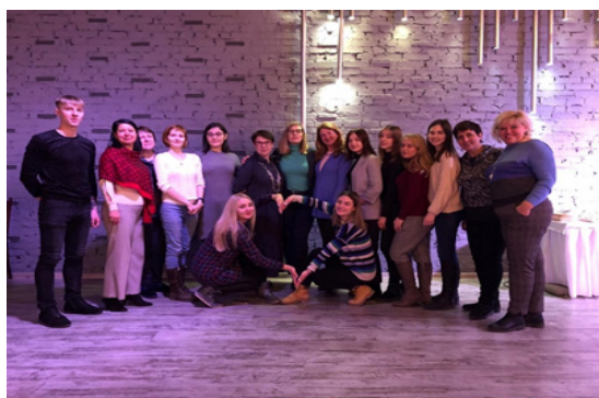
Рис. 9. Участники проекта «Наставники и Ученики» (г. Санкт-Петербург, 2019)

Со 2 по 4 апреля в Новосибирском государственном педагогическом университете проходила VI Научно-практическая конференция «Современные направления психолого-педагогического сопровождения детства». Организаторами конференции выступили фонд поддержки слепоглухих «Со-единение», Академия «Со-единение», Новосибирский государственный педагогический университет и Новосибирский государственный технический университет. За три дня работы конференции в ней приняли участие около 700 человек. Организаторы конференции поставили задачу с помощью специалистов проанализировать современное состояние и тенденции развития общей