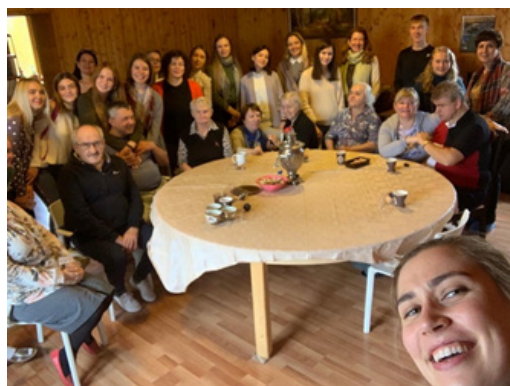
Рис. 11. Наставники и Ученики в Доме слепоглухих в Пучково (2019)

Следует отметить, что опыт нескольких лет волонтерства, участия в международных и всероссийских конференциях фонда «Со-единение» положен в основу нашего регионального исследования «Дидактическая игра как средство развития социальной адаптации детей старшего дошкольного возраста с нарушением слуха и зрения», результаты которого вошли в учебно-методическое пособие «Практическое руководство по созданию дидактических игр как средства развития социаль-