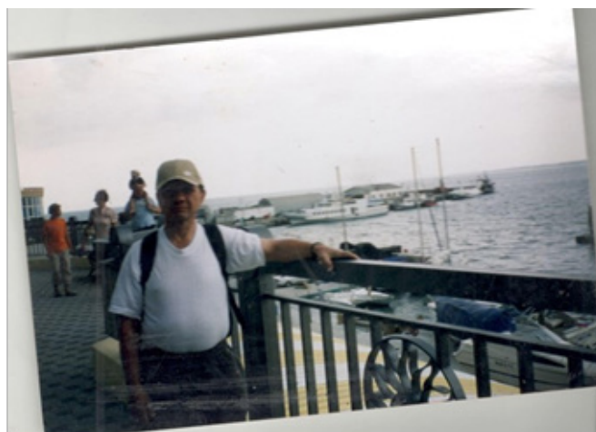
Рис. 10. В путь-дорогу (2005 г.)