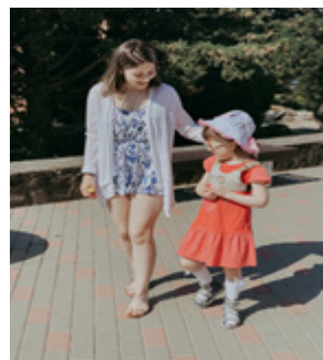
Рис. 3. Геленджик: летняя волонтерская школа (2019)

В летней школе был получен колоссальный опыт для дальнейшего обретения себя в профессии (рис. 4).