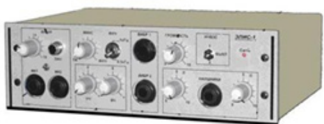
Рис. 5. Прибор «Элис-1»

рефлексотерапии (ЭР) для восстановления слуха людей с нейросенсорной и смешанной тугоухостью и комплектов реабилитационного оборудования «Элис-1» и «Элис-5» фирмы «Элис Веста» (рис. 5).