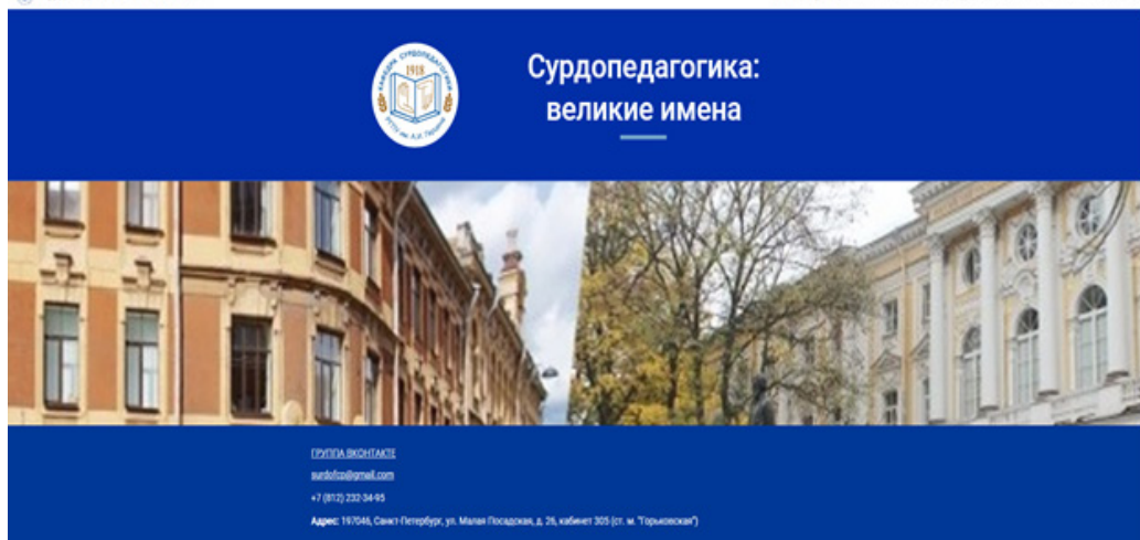
Рис. 1. Главная страница веб-сайта «Сурдопедагогика: великие имена»

Проиллюстрируем наполнение сайта на примере одного из великих сурдопедагогов современности Маргариты Ивановны Никитиной (рис. 2).