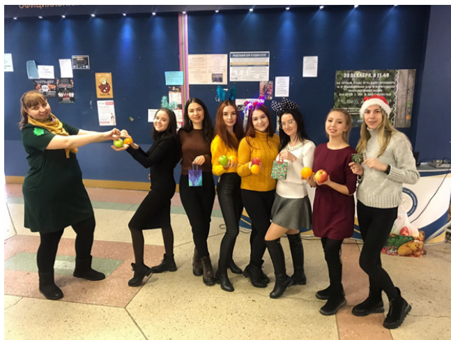
Рис. 17. Выпускники Института детства передают инициативу проведения акции выпускному курсу

В январе 2020 г. автор стала волонтером и сопровождала взрослого слепоглухого человека. Зимняя школа 2020 г. проходила на базе санатория «Голубая речка» в Подмосковье, в городе Звенигород. Организаторами Зимней школы были Фонд президентских грантов и Фонд поддержки слепоглухих «Со-единение» (рис. 18).