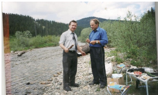
Рис. 8. После чтения лекций на курсах повышения квалификации для сурдопедагогов Красноярского края на базе Минусинской школы для слабослышащих детей, 1985 г.

Слушатели с благодарностью вспоминают и курсы переподготовки по верботональной системе обучения (г. Москва).