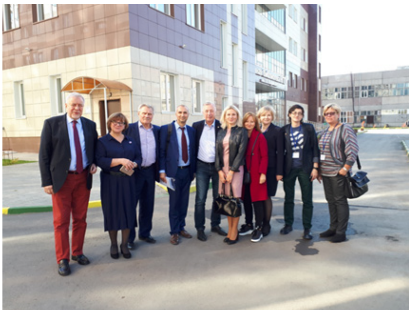
Рис. 7. Делегаты Всероссийского совещания сурдопедагогов (Новосибирск, 2018):