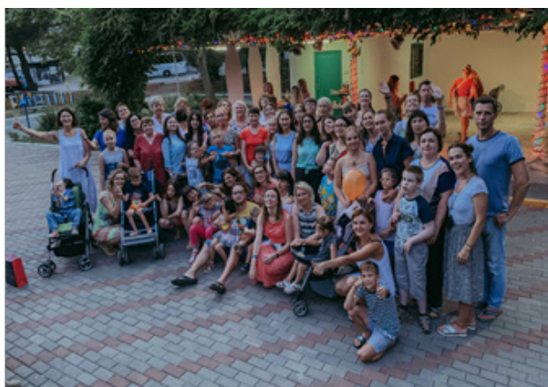
Рис. 5. Дружная смена летнего лагеря (Геленджик, 2019)

Летняя волонтерская деятельность расширила представления автора о слепоглухоте, взаимодействии с родителями и специалистами, сопровождающими ребёнка с тяжёлыми множественными нарушениями в развитии (рис. 5).