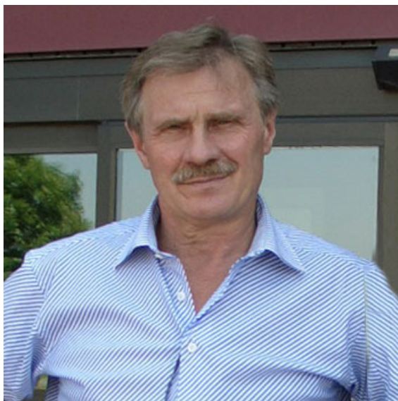
Рис. 1. Геннадий Сергеевич Птушкин (1945–2023)