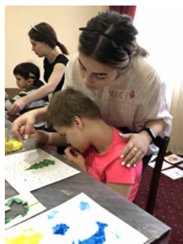
Рис. 8. Проект «Мамина школа» в Новосибирске

«Мамина школа» – это удивительнейший проект, который заряжает безграничной мотивацией помогать семьям, воспитывающим детей с тяжелыми множественными нарушениями в развитии. Кому-то проект помог найти новых друзей, а кому-то – открыть для себя что-то новое.