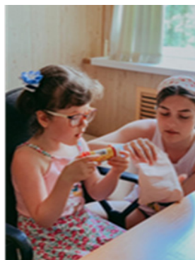
Рис. 4. Сопровождение ребенка с нарушением зрения и слуха

Летняя волонтерская деятельность расширила представления автора о слепоглухоте, взаимодействии с родителями и специалистами, сопровождающими ребёнка с тяжёлыми множественными нарушениями в развитии (рис. 5).