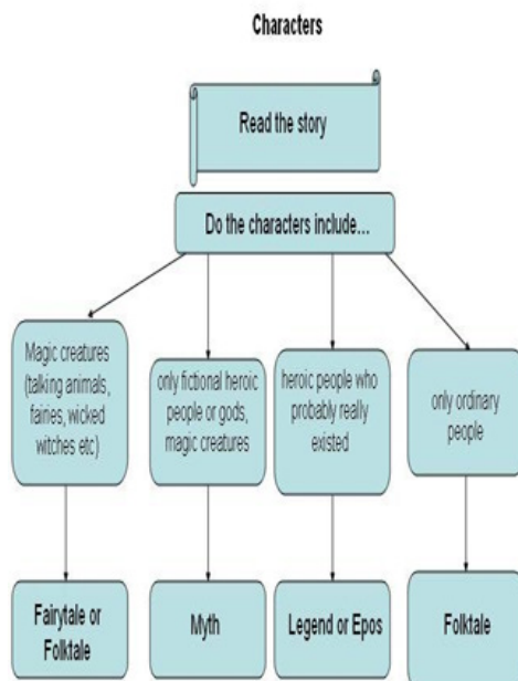
Рис. 4. Переработанная схема персонажей

Второе задание развивало умение поискового чтения. Для этого использовался метод критического мышления «Time Line», взятый из книги Л.И. На-