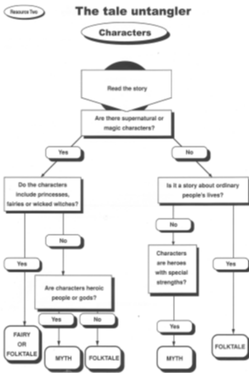
Рис. 2. Переработанная схема сюжета