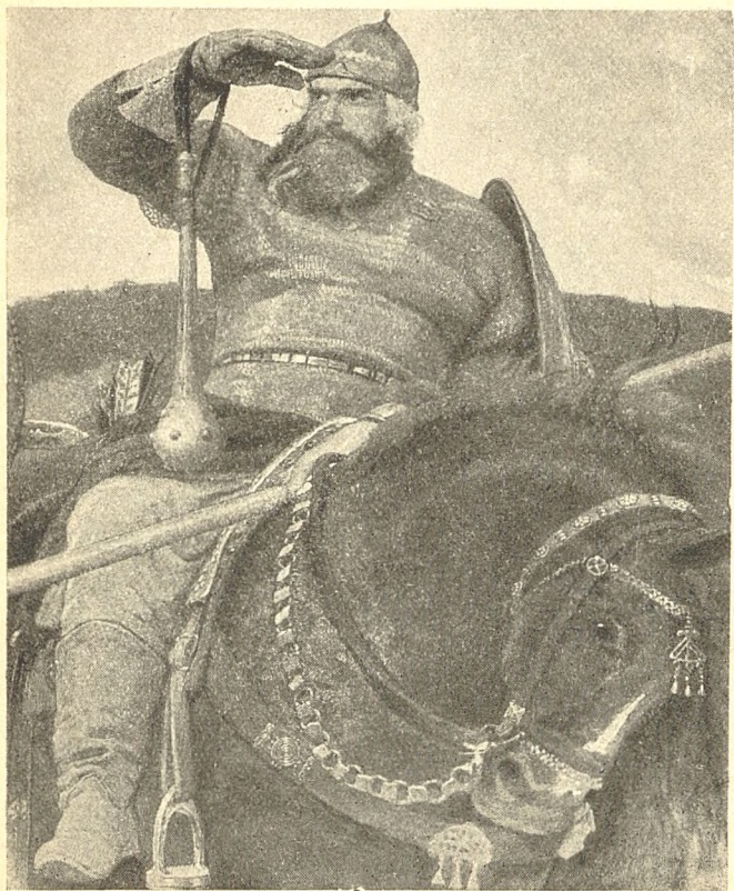
ИЛЬЯ МУРОМЕЦ Деталь картины „Богатыри“