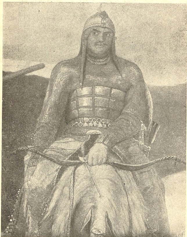
АЛЕША ПОПОВИЧ Деталь картины „Богатыри“