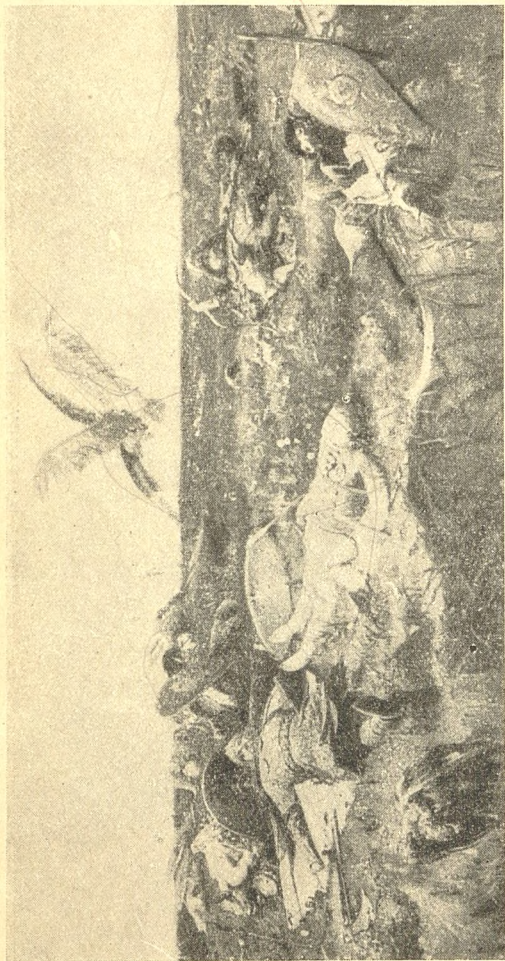
ПОСЛЕ ПОБОИЩА ИГОРЯ СВЯТОСЛАВИЧА С ПОЛОВЦАМИ