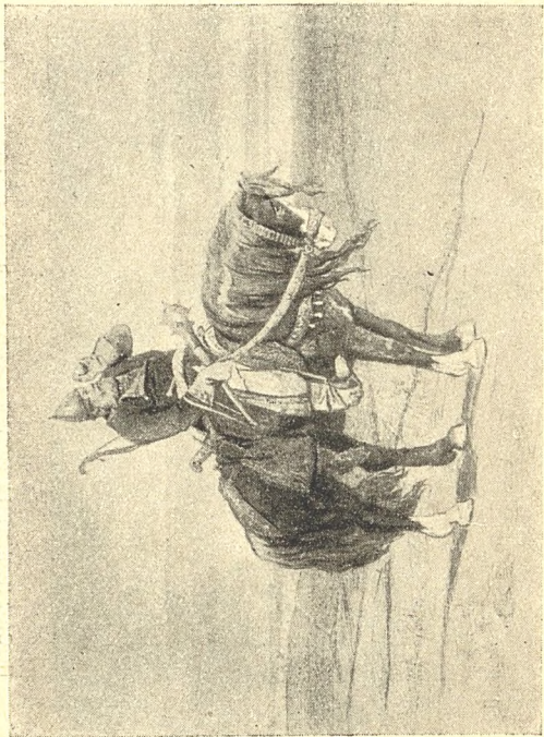
ВИТЯЗЬ НА РАСПУТЬИ Рисунок