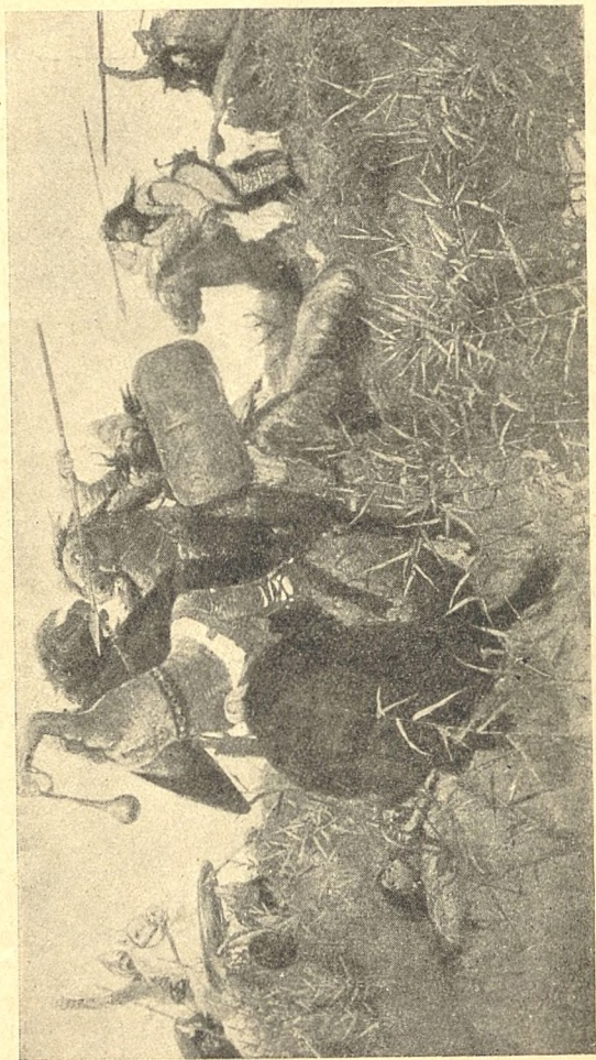
БИТВА СЛАВЯН С КОЧЕВНИКАМИ