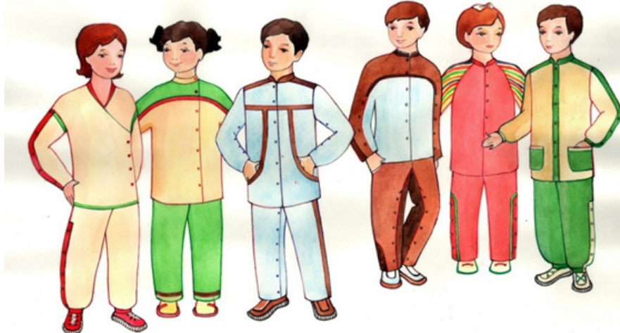
Рис. 2. Адаптивная одежда для детей с ДЦП

На основе проведенных исследований и данных по психофизиологическому воздействию цвета на ребенка разработаны рекомендации колористического решения адаптивной нательной одежды для V-группы лежачих детей с ДЦП и учтены при разработке коллекции [1], показанной на рисунке 2. В качестве цветового решения моделей одежды использованы такие цвета, как светло-зеленый, голубой, розовый, приглушенный желтый в комбинации с тканями в полоску и с мелким рисунком, что в целом создает цветовую гармонию в изделиях.