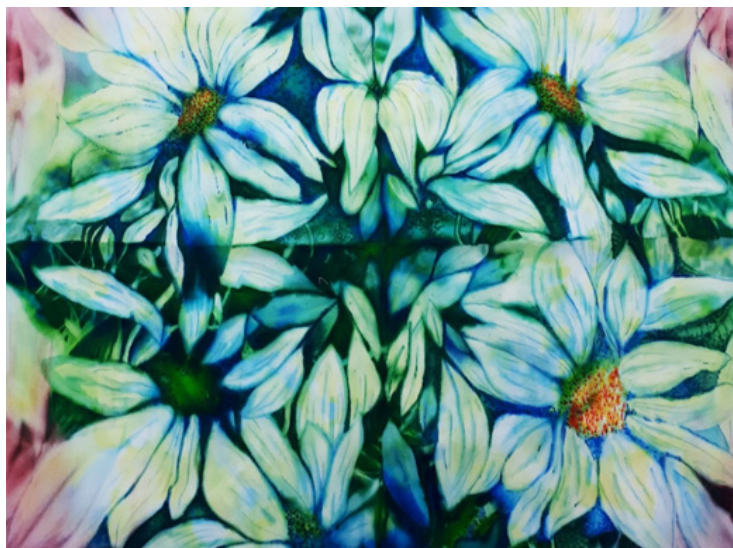
Рис. 8. А. Братышкина. Узелковое крашение в технике стежки, дорисовка маркерами по ткани. Студенческая работа