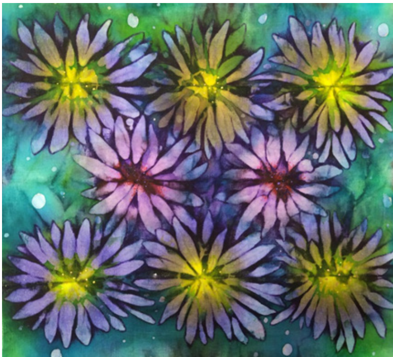
Рис. 5. С. Нагайцева. Узелковое крашение в технике стежки, горячий батик. Студенческая работа