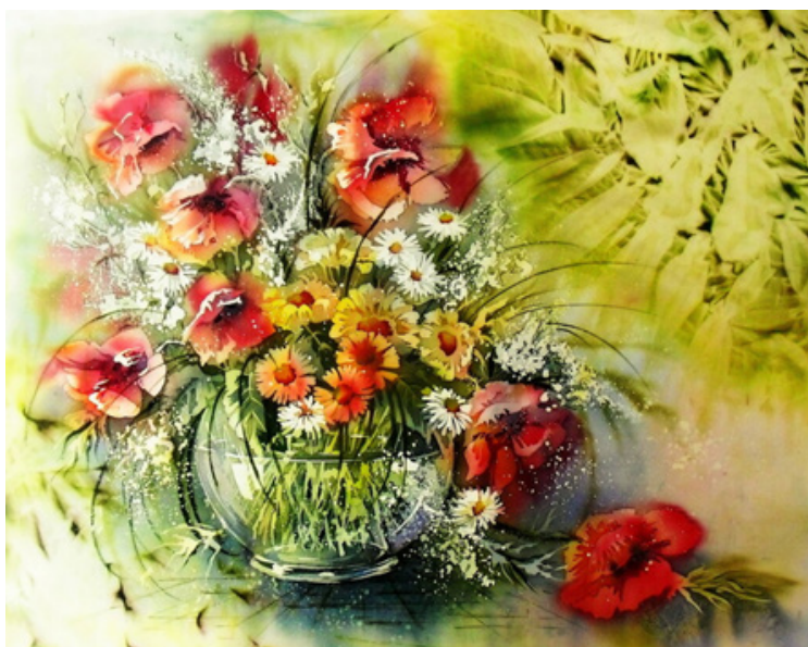
Рис. 4. Ольга Израйлева. Полевые цветы