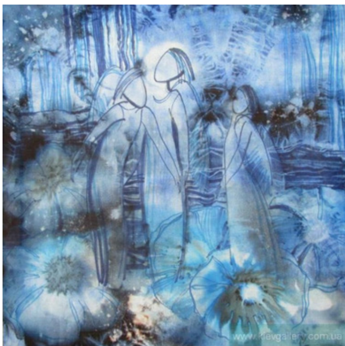
Рис. 2. Лариса Лукаш. Ангелы цветов