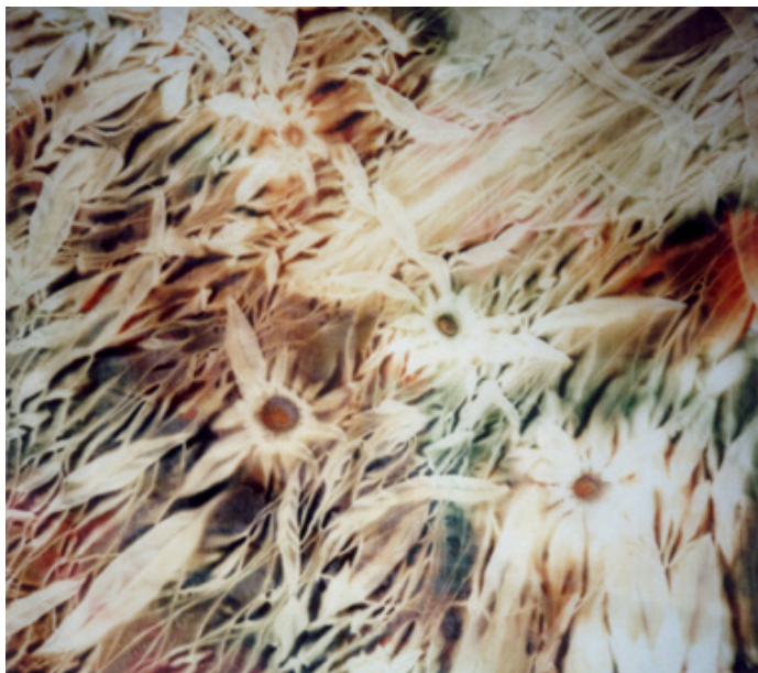
Рис. 1. Татьяна Шалаева. Весна