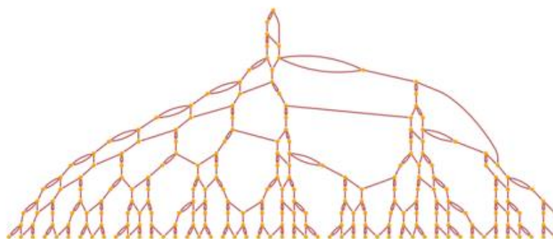
Рис. 1. Причинно-следственный граф, отображающий причинно-следственные связи между событиями Fig. 1. A cause-and-effect graph that displays the cause-and-effect relationships between events

двух состояний. Состояния ячеек обновляются от момента к моменту по простым правилам. Демонстрируется, что эти машины и их многочисленные вариации могут генерировать множество результатов, начиная от очень простых и заканчивая чрезвычайно сложными, например, явления в геофизике, удовлетворяющие фрактальной статистике [17], и, предположительно, поведение организмов. Вольфрам показывает 3 , в частности, что для каждого исторического пути (процесса во времени) причинно-следственный граф, отображающий причинно-следственные связи между событиями, всегда будет иметь ветвящийся вид (рис. 1).