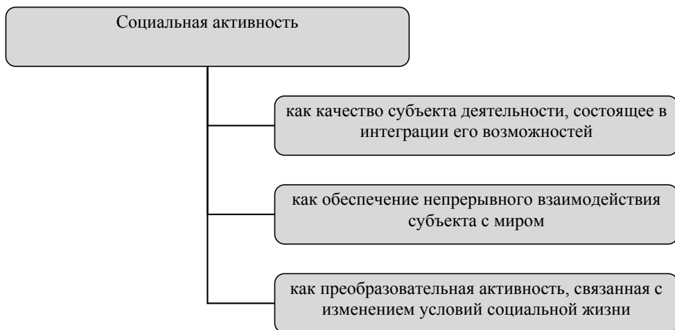
Рис. 1. Основные дефиниции социальной активности (по Е. Е. Бочаровой [4])

М. А. Кленова [7] рассматривает социальную активность в контексте социальной деятельности, в том числе альтруистической, досуговой деятельности, политической, гражданской, социально-экономической, образовательной, протестной, духовной, религиозной, субкультурной активности. И. В. Троцук, К. Г. Сохадзе [12] отмечают, что социальная активность представляет собой совокупность социально-психологических качеств и произвольной деятельности субъекта, обуславливающую уровень влияния индивида на процессы и явления социальной реальности. Социальная активность актуализируется под воздействием потребностей, обладающих выраженным социальным значением. Е. Е. Бочарова [4] определяет социальную активность в различных контекстах (см. рис. 1).