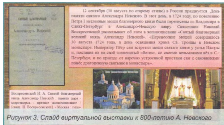
Рисунок 3. Слайд виртуальной выставки к 800-летию А. Невского

Сотрудники библиотеки принимают участие в обучающих семинарах и круглых столах, проводимых Президентской библиотекой.