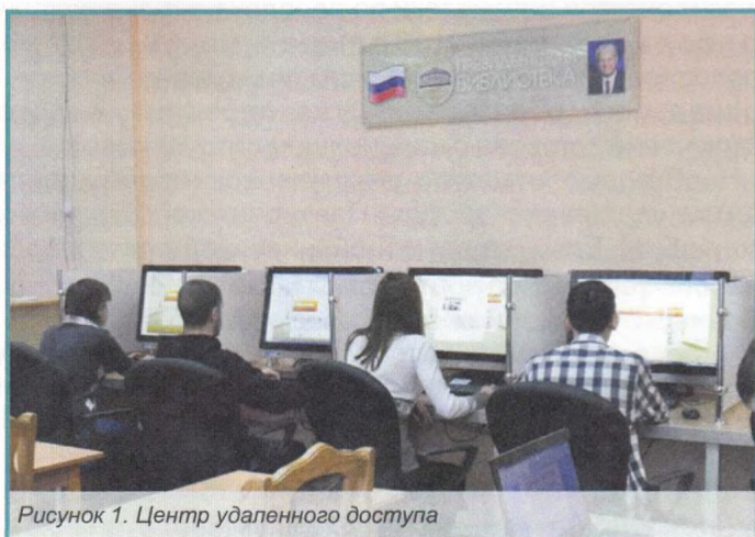
Рисунок 1. Центр удаленного доступа

В 2012 году в Новосибирском государственном педагогическом университете состоялось открытие центра удалённого доступа (ЦУД) к ресурсам Президентской библиотеки им. Б. Н. Ельцина – одной из трёх национальных библиотек Российской Федерации. Библиотека собирает и хранит в электронно-цифровой форме печатные и архивные материалы, аудиозаписи, видео- и иные материалы, отражающие многовековую историю российской государственности, теории и практики права, а также русского языка как государственного языка Российской Федерации.