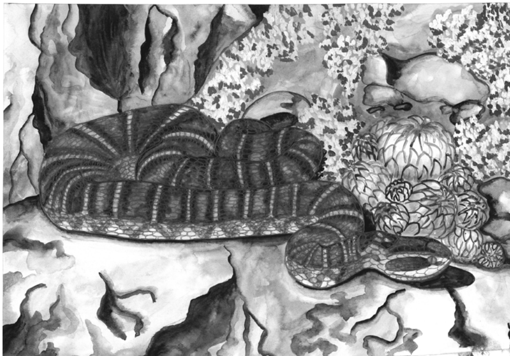
Щит омордник (рис. Е. Клочковой)

Наверняка все согласятся, что в природе нет «простых» созданий: в каждом можно найти что-то удивительное, интересное, прекрасное и достойное восхищения. Даже в таких не очень приятных для многих людей животных, как змеи. В разные времена были разные представления о красоте животных, но змеи всегда вызывали у людей двойственные чувства: гибкое, лишенное ног тело, которое сворачивается кольцами, как канат, вызывало у людей и страх, и восхищение. «Что же в них можно найти удивительного и необыкновенного?» – спросят многие. Вот и хочется переубедить людей, считающих, что в змеях нет ничего интересного, а тем более изящного, изумительного, хочется изменить отношение к этим «нелюбимым» для многих животных.