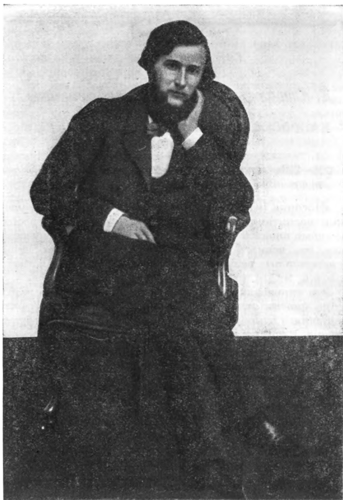
К. Д. УШИНСКИЙ