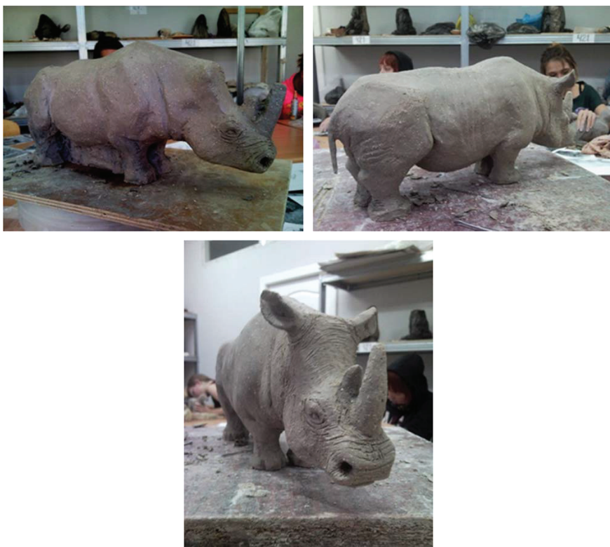
Рис. 4, 5, 6. Проработка деталей животного

Дальше форма прорабатывается более подробно. Уточняется мышечная масса. Так же особое внимание уделяется строению головы животного. Прорабатываются глаза и нос. (рис.4, 5, 6)