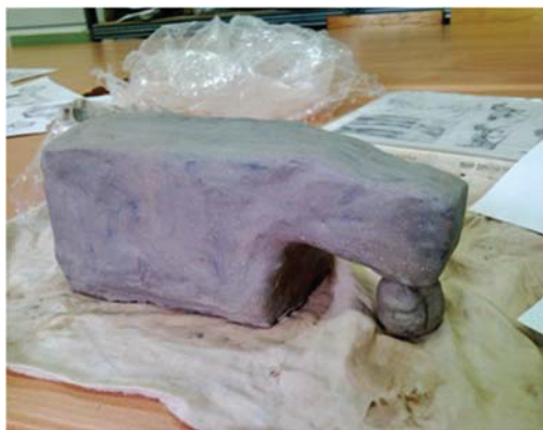
Рис. 2. Уточнение основных пропорций при лепке животного

Затем следует уточнение основных пропорций: ширина длина и глубина грудной клетки Ширина и длина грудного и поясничного отдела (рис. 2).