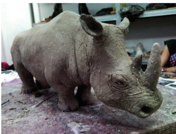
Рис. 7. Использование матовых глазури при декорировании скульптуры

В отличие от выполнения работы из скульптурной массы, изделие из керамической массы может декорироваться керамическими красителями. Очень хороший эффект получается при нанесении глазури напылением. Здесь можно сочетать прозрачные и непрозрачные красители. В этом случае наносится основной цвет и оттеняется другим. В зависимости от замысла можно использовать матовые глазури (рис. 7).