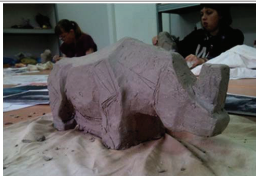
Рис. 3. Схематичное изображение скелета животного

Как показывает практика, основная проблема на этом этапе у начинающих анималистов, понимание строения плече-лопаточного соединения и передней конечности. А также строение грудной клетки и шеи. Следует обратить более пристальное внимание на сочленение лопатки, плеча, локтя, на пропорциональную длину этих костей скелета. И на то, как шейный отдел позвоночника входит в грудную клетку.