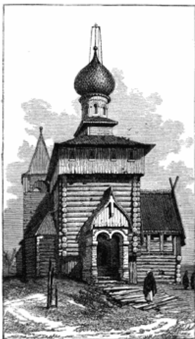
Деревенская церковь в Забайкалье. Гравюра из книги Г.Лэнсделла, изданной в Лондоне в 1883 г.

Нам с братом еще накануне говорили, чтобы мы завтра раньше вставали: кто в Великий четверг встанет до солнышка да обуется, — тот в году много утиных гнезд будет находить.