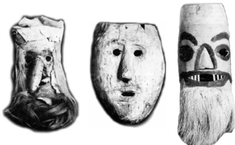
Святочные маски ряженных сибиряков и русских северян, конец XIX – начало XX в. Из коллекции этнографического музея (Санкт-Петербург)

народный календарь в этнографическом отношении» вышла первым изданием в 1913 г. Публикуемые здесь фрагменты датированы по юлианскому календарю (по старому стилю).