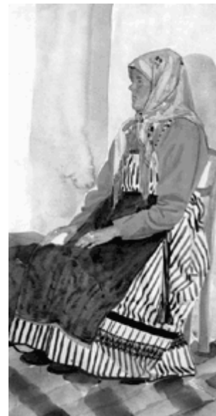
Женщина-старообрядка с Алтая в праздничной одежде.

От маленьких борьба постепенно переходит к большим. В конце концов остается самый искусный борец, которого никто не мог победить, и он, как говорят, уносит круг . Унести круг — это значит одержать такую победу, которая служит предметом гордости не только для самого борца, но и для всего «конца» или деревни, к которым он принадлежит.