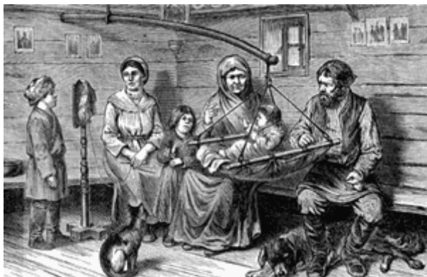
Семья крестьян-сибиряков. Гравюра М. Гофмана (Германия) по эскизу О. Финша, сделанному в Томской губернии в 1876 г.

Эта глава хрестоматии посвящена описанию традиций, характерных для культуры и образа жизни сибирского крестьянства в XVIII — начале XX в.