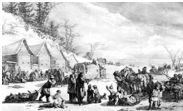
Зимние повозки у постоялого двора. Гравюра из книги, изданной в Париже в 1768 г.

Записи примет, обычаев, поверий и ритуалов сделаны этнографом Антоном Антоновичем Савельевым (1874—1942) в период ссылки (1910—1917) в Пинчугской волости Енисейского уезда Енисейской губернии. В данной публикации они сгруппированы тематически.