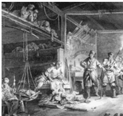
Крестьянское жилище ночью. Гравюра из книги, изданной в Париже в 1768 г.

Бывает, что собака теряет аппетит. В д. Пинчуге, чтоб она ела, рубят ей кончик хвоста, а в с. Богучанах одевают ей на шею ободок из черемухового прутика, обмазанного дегтем, или же просто «дехтярну веревочку».