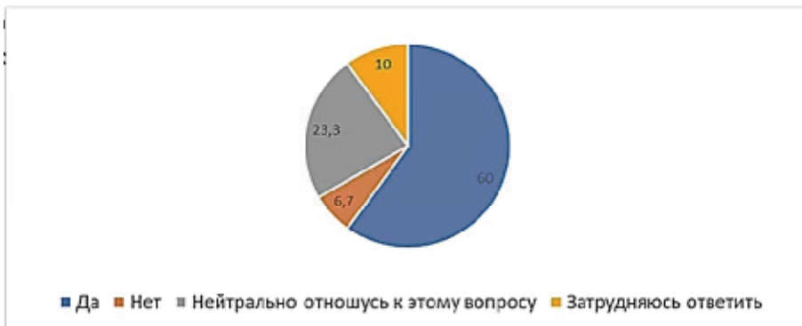
Рис. 2. Результаты ответа на вопрос: хотели бы вы видеть в гардеробе своей дочери предметы одежды с элементами трансформации, которые смогли бы удлинить срок службы изделия, связанный с быстрым ростом ребенка или изнашиваемостью изделия?

Анализируя результаты, стоит отметить, что респондентам, ответившим «нет» и «затрудняюсь ответить» был задан вопрос о причинах такого ответа. Респонденты ответившие так на первый вопрос отмечали сомнения в эффективности трансформации, учитывая предыдущий опыт использования таких предметов одежды, в частности говорили о сложностях трансформаций, а также о быстрой изнашиваемости изделий в результате трансформаций (выходили из строя молнии, изнашивалась тесьма-велкро, вылетали кнопки и т.д.), а респонденты ответившие «нет» и «затрудняюсь ответить» на второй вопрос отмечали свой страх, что кардинальная трансформация предмета одежды может испортить, а не улучшить внешний вид изделия.