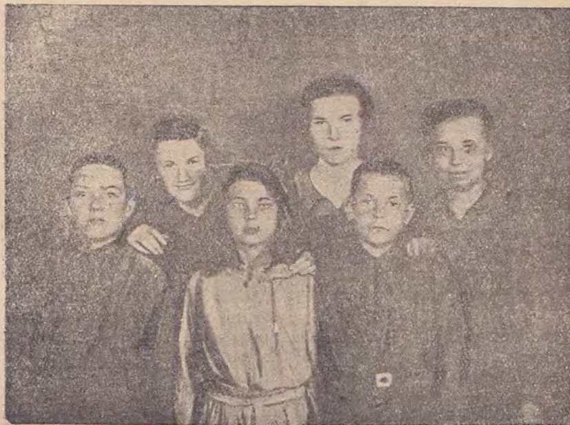
Группа лучших учеников Миролюбовской школы