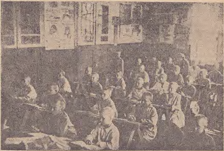
Санаторно-учебный класс при 36 средней школе г. Новокузнецка

Эти трудности, на которые мы не рассчитывали, особенно в образцовой школе, тяжело отражались на деле. Пришлось поставить вопрос об этом перед руководящими органами, после чего, начиная с января месяца, работа в классе несколько наладилась. Эта сторона дела заслуживает внимания в том отношении, что при формирова-