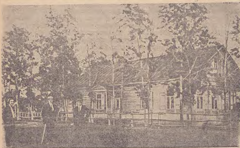
Миролюбовская начальная немецкая школа

С 1911 г. в школе аккуратно сохраняются контрольные «дипломные» работы учащихся, окончивающих эту школу. Даже колчаковщина, гражданская война и период «прожестерства» не могли нарушить этой раз установившейся традиции. Эти действительно дорогие документы свидетельствуют нам о той громадной работе, которая проведена школой.