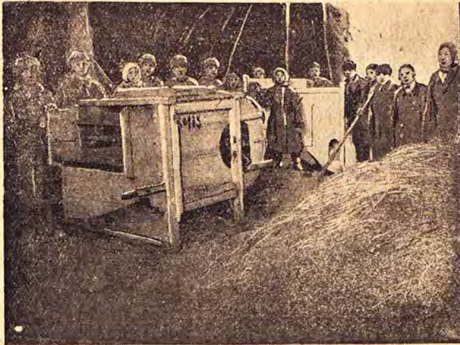
Рабочая бригада. Учащиеся веют и сортируют зерно

Первого октября, утром, ребята сообщают в школе у кого родители едут с хлебом. Десять часов. Подготовка кончена. Демонстрация учащихся движется за поселок к месту соединения обозов — Успенского колхозного и неколхозников (одного с нами сельсовета) с нашим, Московским. Московцы подъезжают первым. Ученики встречают их живыми лозунгами («Да здравствует третий год пятилетки», «Крепи смычку города с деревней», «Даешь красный обоз») и пением «Интернационала». Через три-пять минут подъезжает обоз Успенского колхоза — «Культживотновод», за ними неколхозники. Те же живые лозунги, «Интернационал».