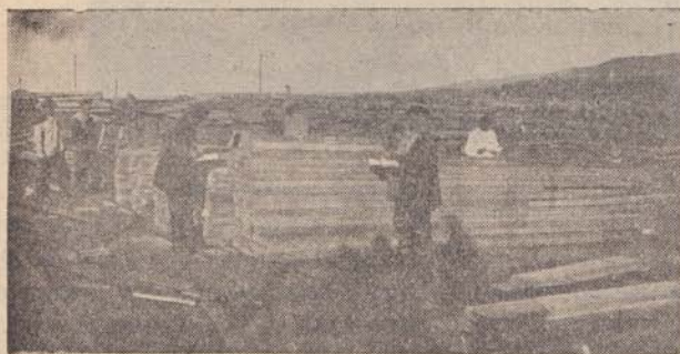
На складе прииртышского леса

Плывем дальше — и у пристани Ермак белые груды соли сменяются черными грудями каменного угля из близлежащих копей Экибастуза, откуда к берегу Иртыша проложена узкоколейка. Экибастуз — тоже один из пунктов социалистического строительства. До революции здесь фактически хозяйничали англичане, пытавшиеся оставить за собой этот исключительный по богатству район. Тут в больших количествах залегают уголь, железо, серебро, медь и другие ценные ископаемые, и если до сих пор данный промышленный район не развивается должным темпом, то только потому, что на это еще не хватает средств. И можно без риска предсказать, что через каких-нибудь