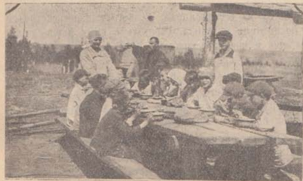
Юные коммунары за обедом.