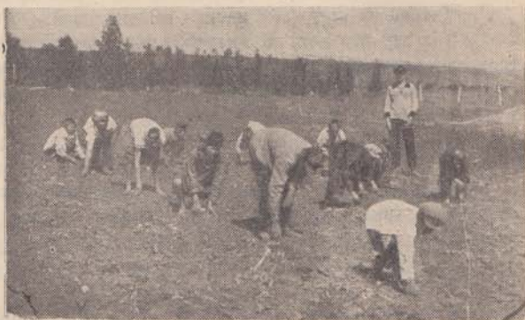
Очистка коммунарами от сорняков посева корнеплодов.

Зимой коммунары посещают местную школу-семилетку. В обязанности 3 - 4 воспитателей коммуны входит, попутно с работой воспитательной, еще и помогать ребятам в части общей школьной учебы. Фактически ни той, ни другой работы как следует не ведется. Воспитательная работа сводится лишь к внешнему надзору за ребятами: смотреть, «чтобы не шалили». Да, по правде говоря, работу по воспитанию и вести-то невозможно. При коммуне нет библиотеки. Нет оборудованного красного уголка, нет ни шахмат, нет радио, нет никаких других разумных и интересных для ребят развлечений. Весь досуг коммунары проводят в каждодневном бесперебойном бренчании на разбитом пианино, в бешеной беготне и возне по коридорам и камерам, в игре в «чижика».