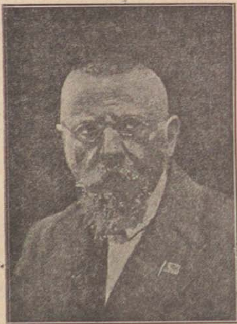
М. Н. Покровский.

Крупнейший историк-марксист, видный деятель социалистического строительства, старый партиз-большевик, с 1905 года работающий в рядах партии, председатель Московского Совета после Октябрьской революции, председатель Сов. Нар. Ком. Московской обл. в 1918 г., член делегации по ведению мирных переговоров с Германией и, наконец, зам. народного комиссара по просвещению и председатель Госуд. Ученого Совета. Разве такому «трудовому списку», даже не полно перечисленному, можно не позавидовать?