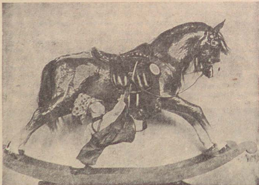
Хочу быть буденновцем.