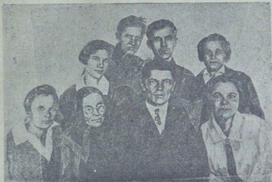
Педагогический коллектив Березовской образцовой начальной школы, Назаровского района

машине на техническое моделирование, и уже в первой четверти ребята построили воздушный коробчатый змей и модель планера. Мы предоставили детям все необходимые пособия по изработке (краски, цветные карандаши, готовальня и пр.), и сразу же выявились среди ребят художники. В 1932 г. мы заметили ряд учащихся—энтузиастов огорода, проявлявших свою инициативу и во внеучебное время; в 1933 г.