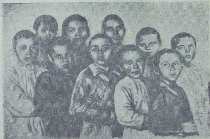
Лучшие ударники учебы Березовской образцовой школы. Учатся только на „хорошо“ и „очень хорошо“

или инструментами). При составлении однодневных нарядов обязательно проверяется выполнение предыдущего. В остальное время года мы практикуем проведение периодических производственных совещаний с участием учителей школы.