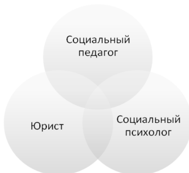
Рис. 1. Взаимосвязи специалистов по реализации комплекса восстановительных мероприятий в системе ювенальной юстиции

Эффективность деятельности указанной триады специалистов во многом зависит от полноты взаимодействия со специализированными судебными органами и несудебными учреждениями: