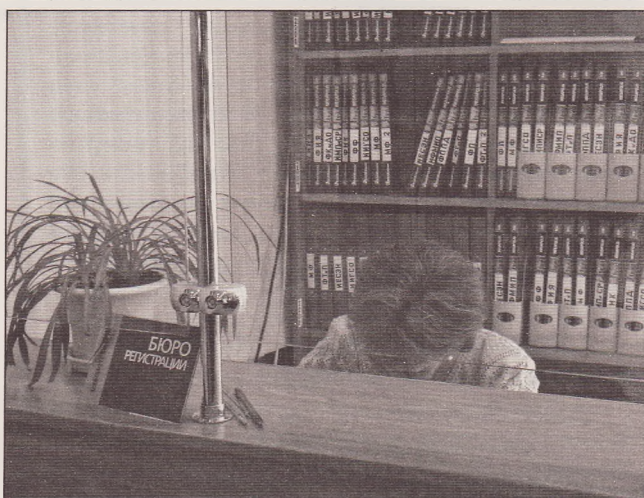
Стойка регистрации посетителей

В настоящее время организован удалённый доступ к электронной библиотеке не только в головном вузе, но и в Куйбышевском филиале НГПУ. Решается вопрос об организации удалённого доступа к арендованным ЭБС. Тем не менее ресурсы электронной библиотеки недостаточно востребованы, в личном кабинете на сайте зарегистрированы за