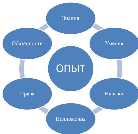
Рис. 1. Модель понятия «компетенция» как система качеств личности

Высшие учебные заведения в соответствии с Федеральным государственным стандартом получили право самостоятельности в части разработки и утверждения основных образовательных программ (ООП) бакалавриата (магистратуры). Образовательная программа разрабатывается высшим учебным заведением самостоятельно с учетом требований рынка труда на основе ФГОС, примерных образовательных программ, разработку которых осуществляет Министерство образования и науки Российской Федерации. При этом примерные образовательные программы имеют рекомендательный характер.