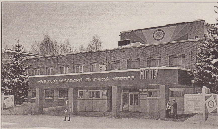
Здание Новосибирского Государственного педагогического университета

затрат. В 1964 г. ректорат принял решение выделить помещение для читального зала.