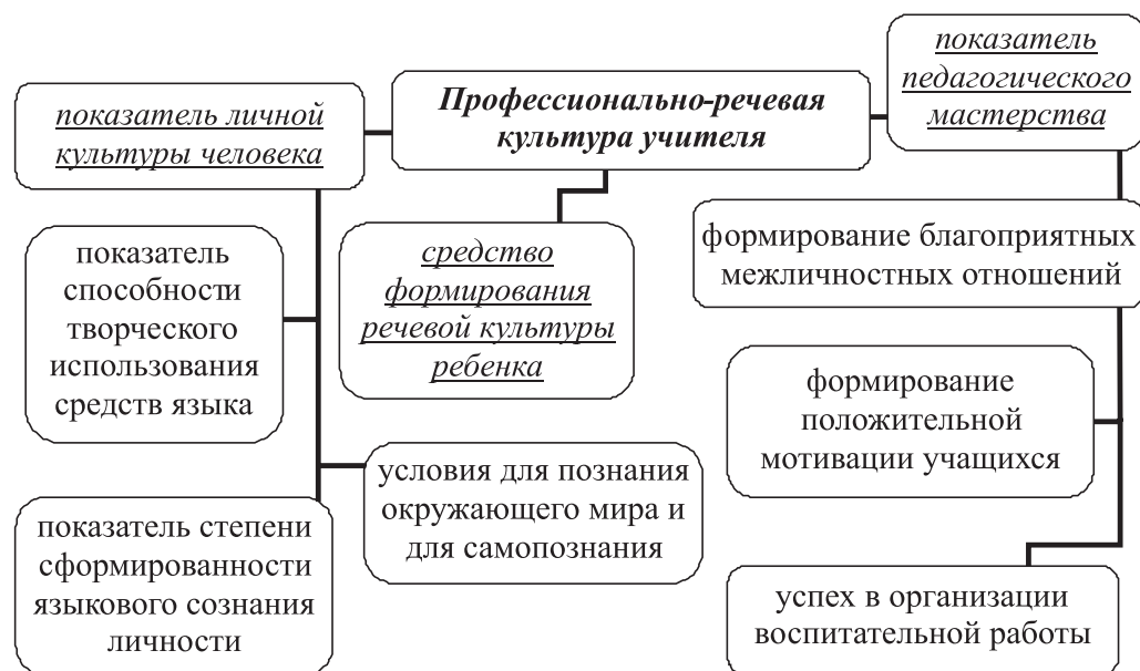
Рис. 2. Структурная схема понимания проблемы профессионально-речевой культуры учителя с позиции педагогического подхода

Педагогический подход к данной проблеме дает также возможность рассмотреть данный феномен в трех аспектах (рис. 2).