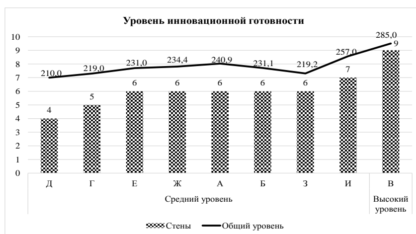
Рис. 2. Соотношение уровня инновационной готовности педагогических коллективов различных вузов

находятся в диапазоне от среднего до высокого уровня.