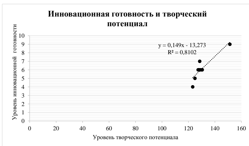
Рис. 4. График линейной регрессии инновационной готовности и творческого потенциала