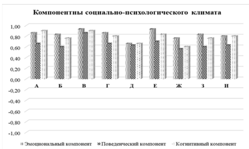
Рис. 1. Соотношение компонентов социально-психологического климата педагогических коллективов вузов

основе индивидуальных показателей преподавателей вузов. При этом оценка компонентов социально-психологического климата исследуемых педагогических коллективов определялась в диапазоне от +0,33 до 1 балла. Это характеризует социально-психологический климат как благоприятный с разной степенью выраженности (рис. 1).