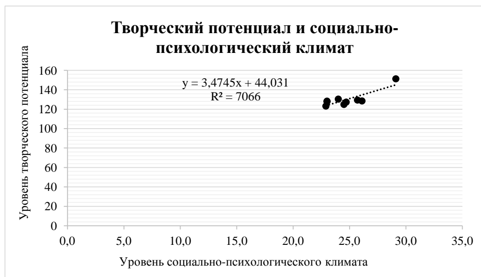
Рис. 5. График линейной регрессии творческого потенциала и социально-психологического климата

Уравнение регрессии имеет следующий вид: y = 0,149 \times -13,273 .