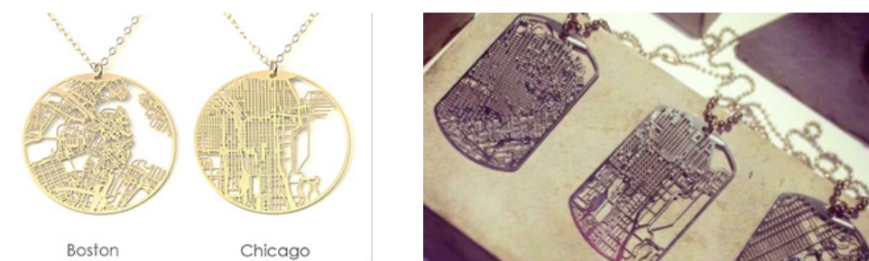
Рис. 1. Коллекция Urban Gridded Dogtags

Такие ювелирные произведения идей, которых послужили карты городов, смотрятся немного технологично, напоминая не то микросхемы, не то набор упорядоченных геометрических элементов.