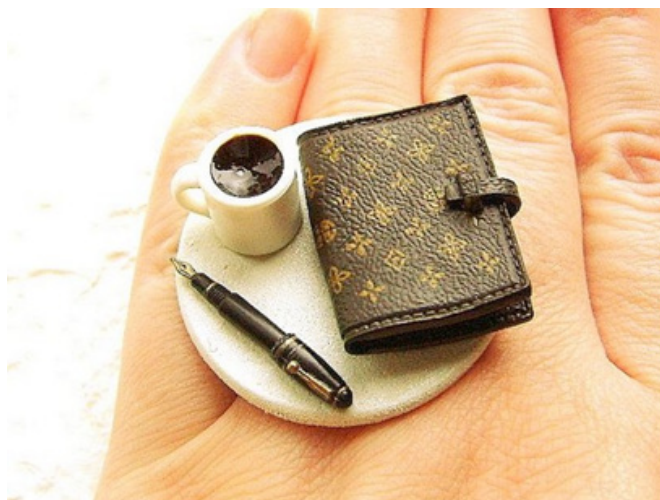
Рис. 7. SouZouCreations. Кольцо

Кофе и лежащий рядом дневник всегда неплохо смотрятся вместе. Ну а если к ним добавить перьевую ручку и разместить это все на маленьком подносике. Казалось бы, такой обычный набор вещей. Но если понимать, что этот набор находится на руке, то удивлению не будет границ. Это необычное кольцо создано SouZouCreations (рис. 7). Производители уверены, что такое оригинальное кольцо предназначено для тех, кто любит созерцать жизнь и при этом записывать свои мысли [4].