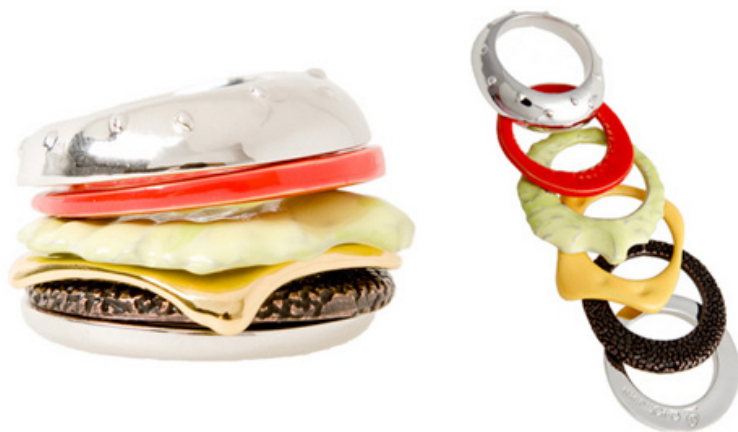
Рис. 6. Кольцо «Burger»

Кофе и лежащий рядом дневник всегда неплохо смотрятся вместе. Ну а если к ним добавить перьевую ручку и разместить это все на маленьком подносике. Казалось бы, такой обычный набор вещей. Но если понимать, что этот набор находится на руке, то удивлению не будет границ. Это необычное кольцо создано SouZouCreations (рис. 7). Производители уверены, что такое оригинальное кольцо предназначено для тех, кто любит созерцать жизнь и при этом записывать свои мысли [4].