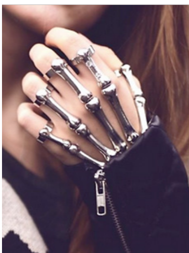
Рис. 4. Аксессуар «Скелет руки»