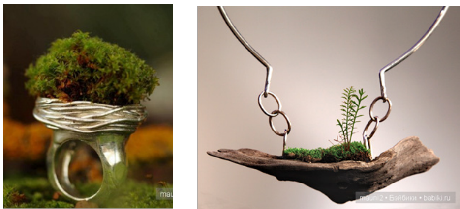
Рис. 8. Коллекция «живых» аксессуаров Клелии Стинчедду

растущий внутри них мох, который поливают, чтобы он оставался свежим и продолжал расти, его рост может продолжаться длительное время (рис. 8).