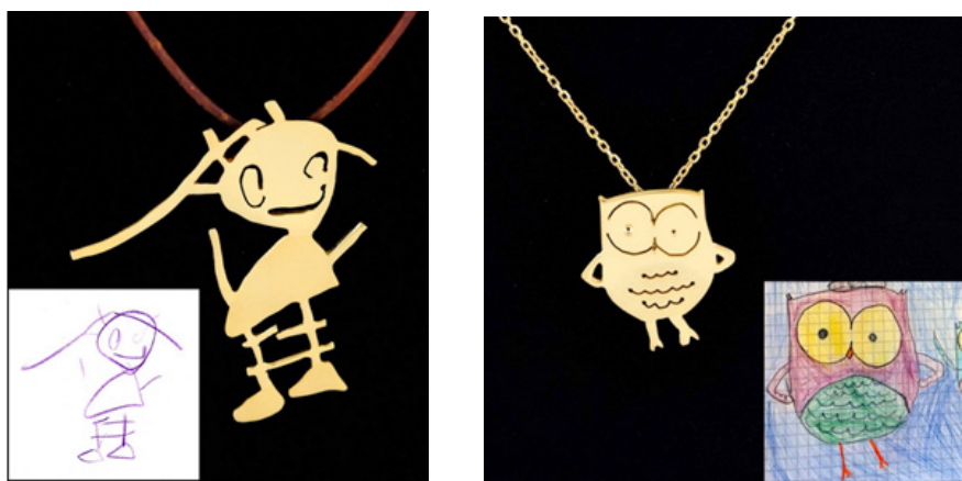
Рис. 2. Ювелирные украшения от студии Tasarim Takarim: в основе дизайна – детские рисунки

Еще одно из новых направлений ювелирного дизайна – миниатюрные композиции в стеклянных шарах. Художники вставляют в перстни вместо драгоценных камней стеклянные шары, заполненные различными материалами. Это могут быть семена одуванчика, создающие ощущение легкости и нежности, или урбанистический проект с шестерёнками от часов, легкое и воздушное оригами, различные зверюшки (рис. 3). Порой кажется, что у художников есть варианты дизайна на любой случай. Одни из перстней смотрятся стильно, вторые эпатажно, третьи наивно. По таким украшениям можно определить интересы его владельца. Но все они имеют место быть в современном дизайне. Ведь ювелирное украшение начинает жить, когда оно находит своего потребителя. И, похоже, у авторов этих работ есть свой потребитель.