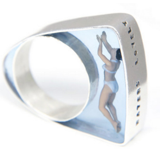
Рис. 5. Перстень «Пловец»