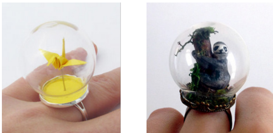
Рис. 3. Современный ювелирный дизайн

Профессиональные ювелиры поражают своей нестандартной творческой фантазией. Их изделия выходят за рамки функциональных. Современные ювелирные изделия потеряли важное символическое значение, они приобрели креативность дизайна и мастерства. Изделие «Скелет руки» (рис. 4) надевается не только на пальцы, но и на запястье, чем производит незабываемое впечатление на окружающих. Перстень «Пловец» (рис. 5) от дизайнера Helen Noakes отражает новые идеи в дизайне, демонстрирует силуэт девушки, купающейся в бассейне. Кольцо «Burger» вызывает двоякое чувство. С одной стороны, вызывает недоумение как это вообще можно носить. С другой стороны, поражает креативность автора в подходе к дизайну изделия, которое ещё и состоит из 6 отдельных частей, имитирующих различные продукты.