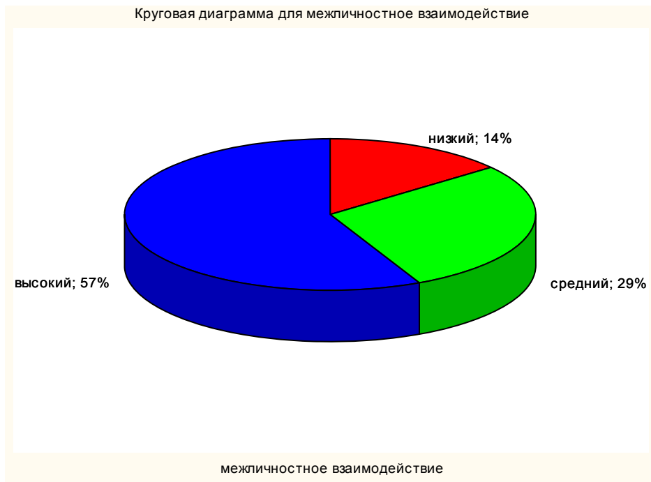
Рис. 1. Процентное распределение курсантов по признаку межличностного взаимодействия

Результаты распределения курсантов на подгруппы демонстрирует, что большинство военнослужащих характеризуются высоким уровнем межличностного взаимодействия (57 %), обладают полезависимостью, стремятся к участию в массовых мероприятиях и принятию решений совместно с другими людьми (рис. 1).