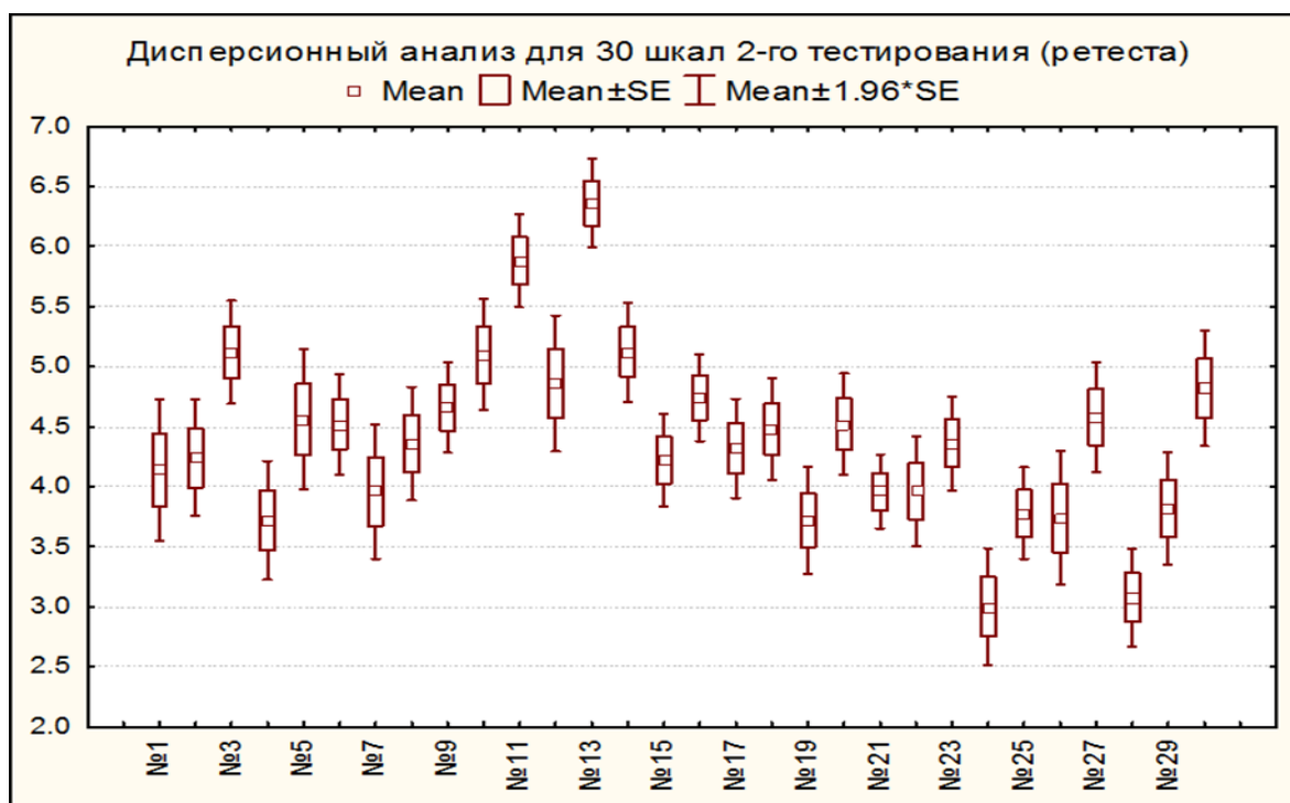
Рис. 3. Интервальные графики дисперсионного анализа для 30 вопросов второго наблюдения 50 респондентов. Mean – среднее; SE – стандартная ошибка среднего

\lambda_1 – наибольшее значение характеристического корня матрицы интеркорреляций пунктов (наибольшее собственное значение, или абсолютный вес первой главной компоненты, т. е. её вклад в общую дисперсию шкал теста).