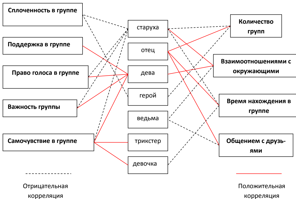
Рис. 3. Имазо-ролевая модель корреляций подростков в сфере контактов Fig. 2. Imaso-role model of correlation of adolescents in the sphere of contacts

Итак, чем выше ролевая представленность в сфере контактов ролевого импозита девы у девочек, характеризующегося конформностью, ориентацией на мнение окружающих, чувствительностью [4], тем больше представительницы женского пола удовлетворены взаимоотношениями с окружающими ( r = 0,37 при p = 0,02 ). Они оценивают свое самочувствие в группе как высокое ( r = 0,4 при p = 0,006 ), ощущая важность группы ( r = 0,4 при p = 0,01 ) и поддержку в группе ( r = 0,35 при p = 0,04 ), отмечая возможность права голоса в группе ( r = 0,53 при p = 0,000 ). Роль отца, более выраженная у мальчиков, связана с большим количеством групп ( r = 0,38 при p = 0,02 ), увеличенным временем нахождения в группе ( r = 0,48 при p = 0,001 ), кроме того,