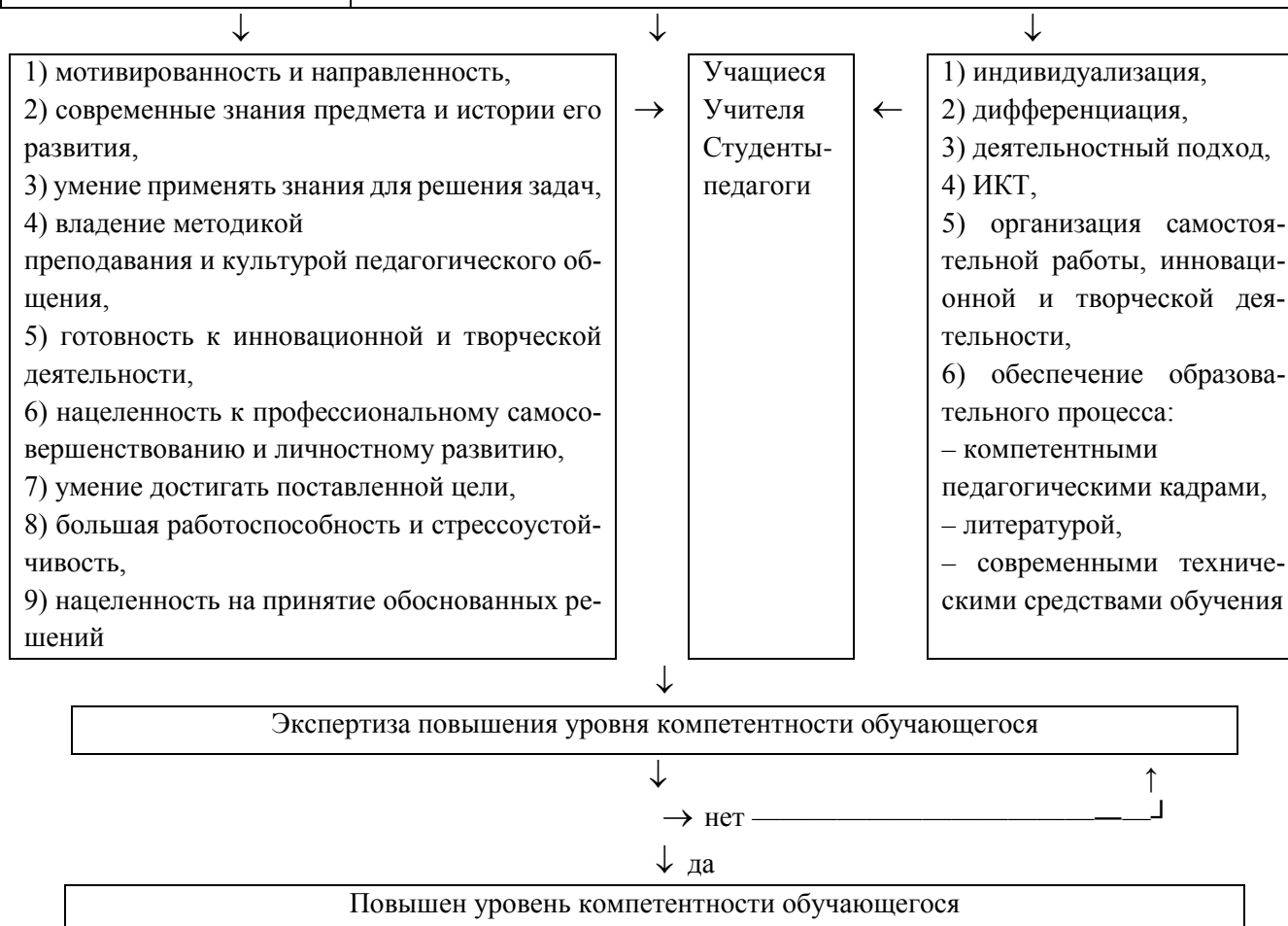
Рис. 2. Интеграционная модель повышения уровня компетентности по теме «Функция переменных рациональных степеней и ее приложения»