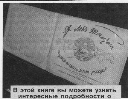
В этой книге вы можете узнать интересные подробности о творчестве Л. Н. Толстого

Ценители литературы могут познакомиться с изданием Николая Васильевича Гоголя «Мертвые души» 1900 года. Также в ценном фонде библиотеки хранятся уникальные при-