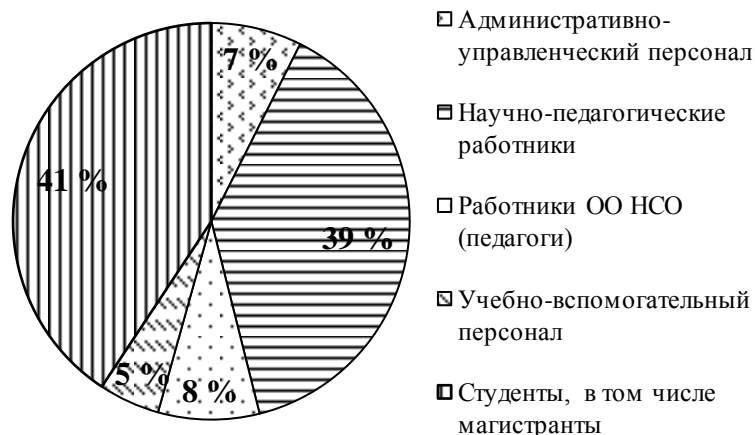
Рис. 1. Распределение участников конференции по категориям