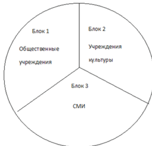
Рис. 2. Структура культурной среды

испытывает разноплановые воздействия. Какую-то часть культурного пространства он, руководствуясь личностными предпочтениями, сознательно возьмет, и это станет его культурным полем.