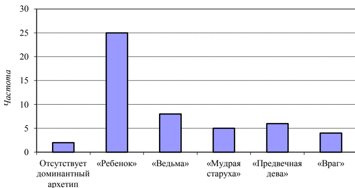
Рис. 2. Распределение детей по наличию доминантного архетипа в выборке младших школьников

находиться в волшебном и сказочном мире. При этом архетипическая идентичность с архетипом ведьмы сказывается на отношениях с близкими и родными людьми, с которыми ребенок соперничает и от которых отчуждается.