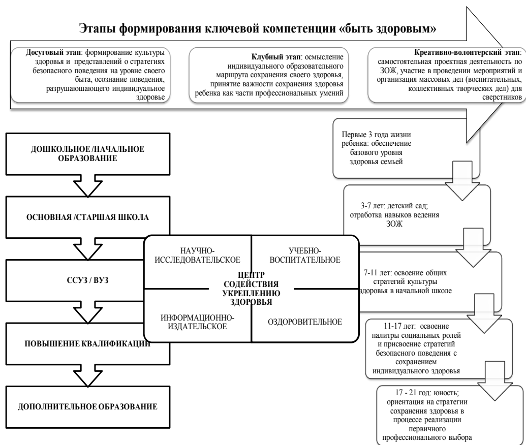
Рисунок 1 – Центр содействия укреплению здоровья как пространство формирования ключевой компетенции «быть здоровым»

федеральных государственных образовательных стандартов и вступлением в силу с 1 сентября 2013 года нового закона «Об образовании». Дополнительное образование детей, оформившееся из внешкольного образования с принятием предыдущей версии закона «Об образовании», вновь трансформируется. Потребность молодежи в дополнительном опыте социализации, проявлении своих способностей и талантов как естественная часть процесса взросления всегда присутствовала в культуре. Дополнительное образование детей, понимаемое как реализация вариативных, необязательных образовательных программ и услуг в интересах личности, общества, государства, постепенно реформируется. Таким вариативным является образовательное пространство, которое способен создать центр содействия укреплению здоровья [1; 5; 6].