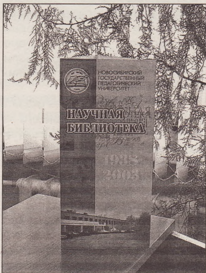
Один из проспектов, выпущенных библиотекой

Важной составной частью библиотечного обслуживания является выставочная деятельность библиотеки. Выставка предполагает непосредственный показ книг и материалов, раскрывающих их содержание. Оформляются выставки к юбилейным и памятным датам, тематические выставки с целью патриотического, эстетического,