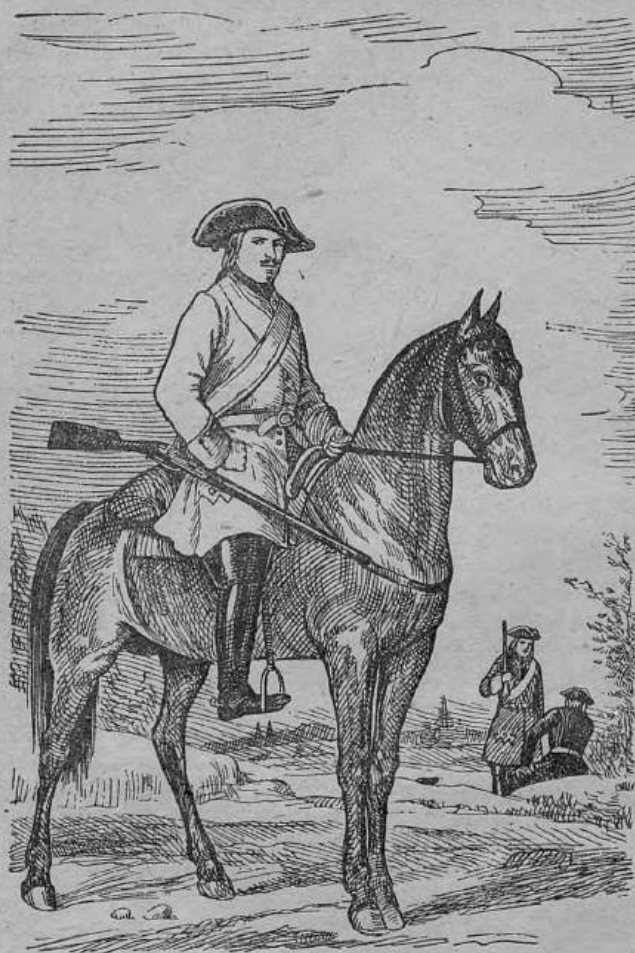
Русский кавалерист (драгун)

вовведения. Петр ввел обычный для западноевропейских войск линейный порядок движения и действия войск; внес правильный взгляд на оборону как на один из видов боя, предваряющий решительное наступление; установил правильное употребление в бою огнестрельного и холодного оружия — сперва залп, а затем удар в штыки. Ему принадлежат идеи ма-