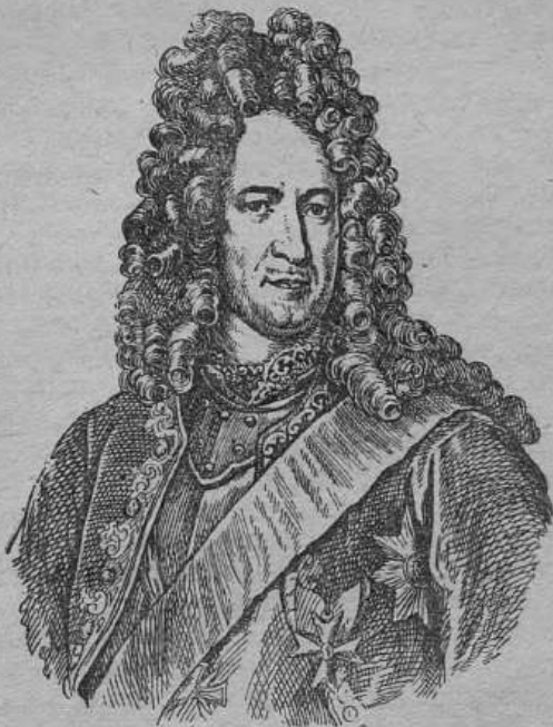
А. Д. Меншиков

Положение Карла с каждым днем все более осложнялось. После присоединения жалких остатков отряда Левенгаупта к его главным силам, в конце октября, в главную шведскую квартиру под Новгород-Северским прибыл Мазепа с частью старшины, приведя с собой всего лишь 2 тысячи казаков.