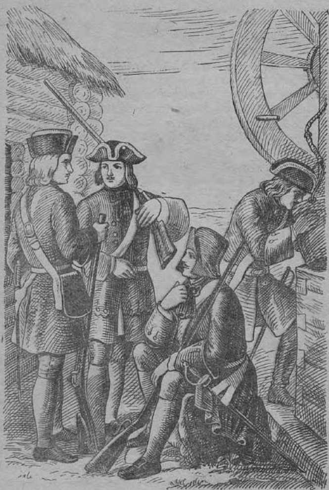
Пехотинцы русской армии

проявления личной инициативы начальниками отдельных частей.