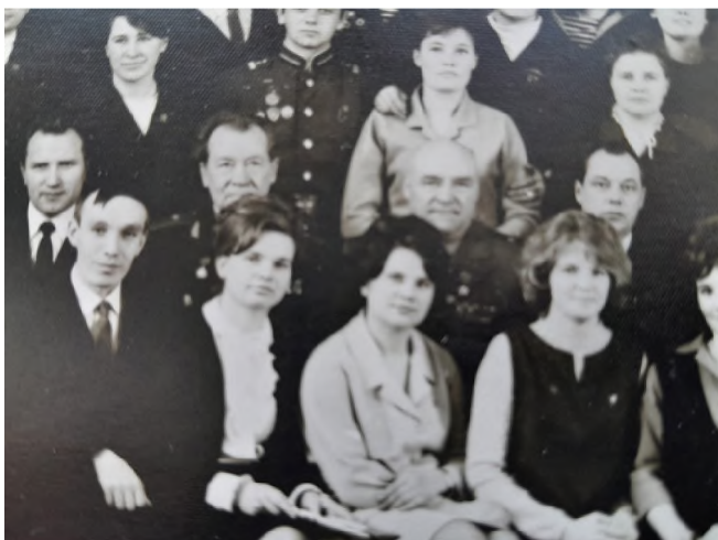
Рис. 38. Секретарь райкома комсомола (вторая слева, первый ряд)