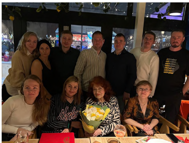
Рис. 36. Дети – это лучшие друзья! (2025 г.)

Дети – это лучшие друзья! Поддерживаю с ними отношения, всегда на связи! (рис. 36).