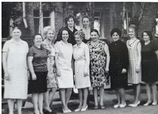
Рис. 10. Сотрудники детского сада 211, 1971 г.

Так и работала в 41 детском саду с 1962 по 1988 гг., когда он переехал в Ленинский район и стал 219 детским садом, потом его перевели в 311 детский сад, на Блюхера (рис. 10).