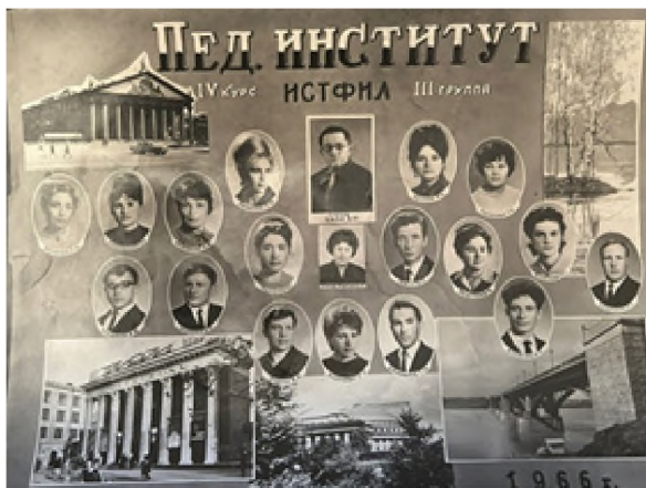
Рис. 24. Выпуск 1966 г., ИСТФИЛ НГПИ