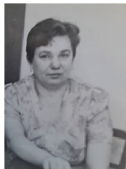
Рис. 39. Секретарь райкома партии