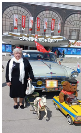
Рис. 43. Позитивный взгляд на мир