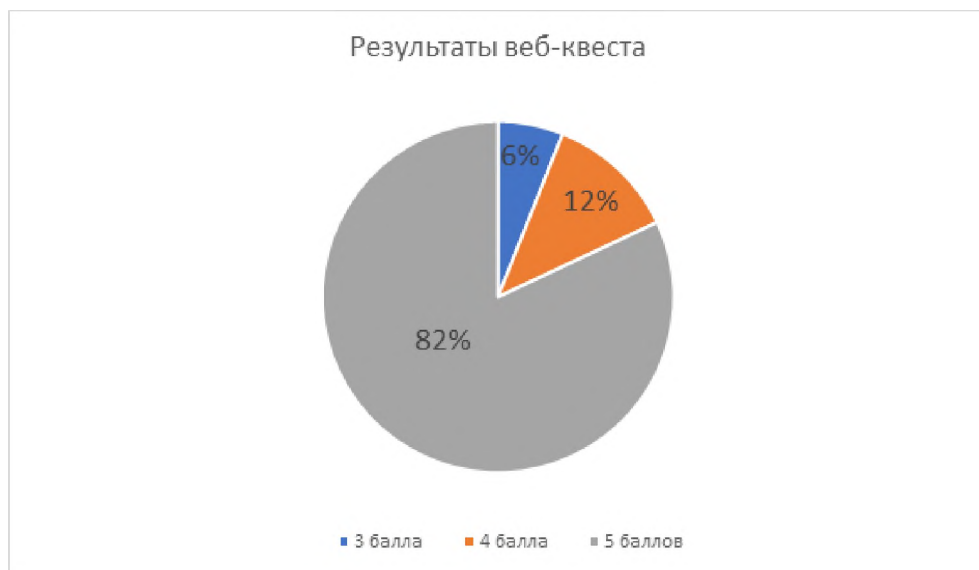
Рис. 2. Результаты веб-квеста "Food and drinks"

Проанализируем результаты обучающихся, полученные после прохождения веб-квеста. Из 16 обучающихся во время занятия 3 из 5 баллов получил 1 обучающийся, 4 из 5 баллов получили 2 обучающихся и 5 из 5 баллов получили 13 обучающихся. Результаты в процентном соотношении представлены на рисунке 2.