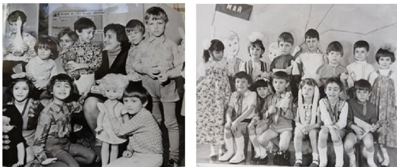
Рис. 15. Красивые дети

Дети хорошие были. Я не знаю, почему, но мне казалось, что у меня дети самые красивые. Ты же с ними 3–4 года, и ты к ним привыкаешь. И мне казалось, что в моей группе самые красивые дети, не знаю, почему. Глухие, правда, очень хорошие и очень красивые (рис. 15).