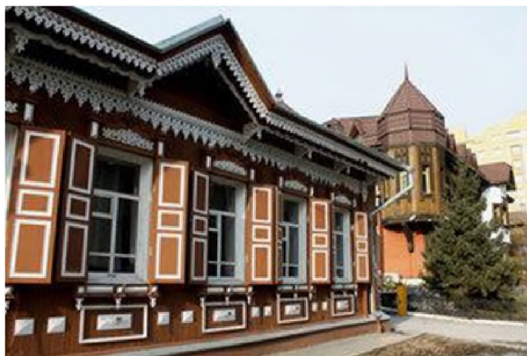
Рис. 9. Жилой дом был построен томским купцом Григорием Рафаиловичем Бейлиным в 1906 г. на 7-м участке 22-го квартала центральной части г. Новониколаевска по ул. Гудимовская (ныне ул. Коммунистическая). Здание является примером городского дома начала XX в., в стилистике которого присутствуют традиции народного зодчества. Вместе с соседними домами, формирующими фронт застройки улицы, здание представляет один из немногочисленных сохранившихся фрагментов городской среды дореволюционного Новониколаевска. В этом доме начинал свою жизнь детский сад для глухих детей в г. Новосибирске

Сам детский сад № 41 располагался на Коммунистической, 25 (рис. 9).