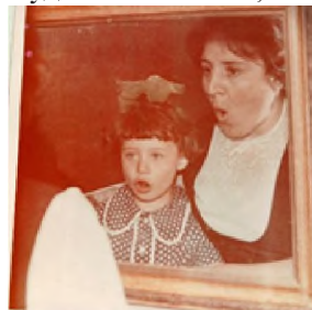
Рис. 14. Работа над автоматизацией звука

Если у ребенка сразу не получалось, об этом надо мягко сообщать родителям, не резко. По молодости могла сказать напрямую, потом поняла, что так нельзя, надо постепенно, деликатно, училась общению с родителями на своих ошибках. Так лучше сказать: «Она у вас пока отстаёт, мы попробуем то-то и то-то...» (рис. 14).