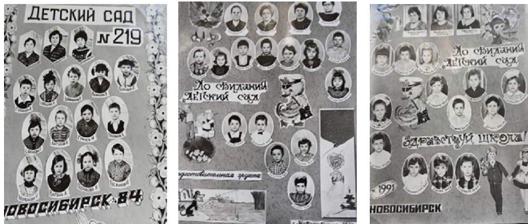
Рис. 17. Выпускники детского сада глухих разных лет

Так мы работали много лет на благо счастливого детства глухих детей. Однажды в детский сад пришли представители городского сурдологического центра (руководитель, сурдолог, аудиолог), посетили мое занятие и пригласили консультировать как детей, так и взрослых в качестве сурдопедагога сначала в 1-й Центральной поликлинике, затем в Областном сурдологическом центре – в 20-й поликлинике. Таким образом, мое профессиональное поле расширилось, но главной всегда оставалась работа в детском саду с глухими детьми (рис. 17).