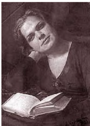
Рис. 8. Бронислава Давыдовна Корсунская (10 (23) сентября 1909 г., г. Киев, Российская империя – 1 июля 1986 г., г. Москва, СССР), кандидат педагогических наук (1944), выдающийся отечественный дефектолог, один из основоположников современной российской сурдопедагогики, разработчик оригинальной системы дошкольного воспитания и обучения глухих детей, автор трех первых в мире книг для самостоятельного чтения глухими дошкольниками «Читаю сам», более 100 научных работ, методических и учебных пособий, инициатор создания трех первых в истории сурдопедагогики фильмов о маленьких глухих детях: научно-популярного «Я понять тебя хочу» и учебно-методических «Они будут говорить», «Если ребенок не слышит»

проявила инициативу принять участие в эксперименте Брониславы Давыдовны Корсунской (рис. 8), которая тогда ввела дактилологию как средство развития речи в дошкольном образовании глухих.