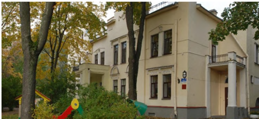
Рис. 6. Сегодня это лаборатория образовательных инноваций в Петроградском районе, детскому саду 105 лет, расположен он на 1-й Березовой аллее, 5 в старинном здании – усадьбе Михина (памятник градостроительства и архитектуры, объект регионального значения, постройка 1909 г.)

– Я решила работать по специальности, когда училась на 3 курсе, и пришла в детский сад № 1 для глухих детей на Петроградской стороне в 1955 г. Сегодня это Государственное бюджетное дошкольное образовательное учреждение детский сад «Кудесница» (рис. 6).