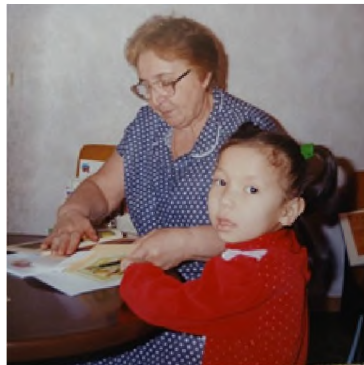
Рис. 19. Все, что происходит с ребенком на занятии, надо объяснять родителям

Если с самого начала выстраивать отношения так, чтобы они не вредили ребенку, то с родителями все получается и, в дальнейшем, в процессе обучения ребенка в детском саду больших сложностей не возникает. Главное, чтобы родители дома продолжали начатое учителем-дефектологом дело, тогда точно ребенку будет комфортно учиться (рис. 20).