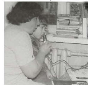
Рис. 13. Развитие слухового восприятия и обучение произношению

поставить голос, которым он будет говорить всю жизнь. Это надо было объяснить родителям. Каждого вызывала родителя в кабинетик – кусочек, отделенный в группе и просила: «Вот вы послушайте, как он говорит. Постарайтесь, чтобы дома вы сохранили этот тембр голоса, потому что от тембра голоса зависит постановка звука, а если тембр голоса будет другой, то и звук будет другой, речь будет непонятная, невнятная, поэтому послушайте внимательно и дома постарайтесь это сохранить» (рис. 13).