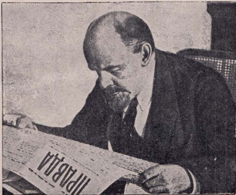
ВЛАДИМИР ИЛЬИЧ УЛЬЯНОВ - ЛЕНИН