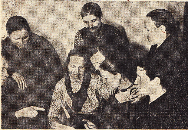
Группа технических работников — делегатов с'езда.

«Новый этап экономического развития, этап социалистической переделки всего народного хозяйства (промышленности и земледелия) пред'явили новые, более повышенные требования ко всему культурному строительству в целом и в частности к народному просвещению, вытекающие из лозунга культурной революции» (Из решений с'езда). Так определил с'езд те громаднейшие задачи, которые в данный момент налагают на нас в большой степени ответственность за тесное сотрудничество органов народного образования, органов союза и широких масс общественности и армии работников просвещения на фронте борьбы за культуру, за улучшение качества работы, за лучшую классовую выдержанность во всем содержании просветработы.