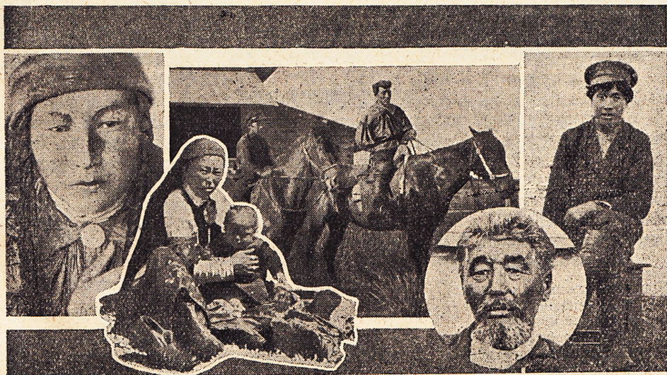
Типы хакасов: 1—сагайка; 2—каченка; 3—бельтир; 4—качинец; 5—сагаев.

Селения хакасов—улусы—разбросаны в широких просторах Абаканской, Уйбатской и Июсской степей, по течению рек, речек и ключиков, то группами, то в оди-