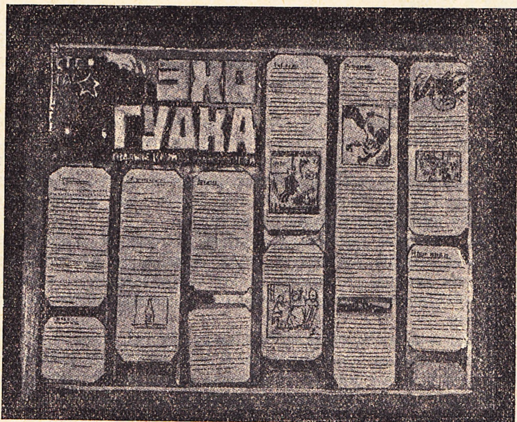
Передвижная газета «Эхо Гудна».

Поэтому найдена другая форма стенгазеты, известная под названием—«передвижка».