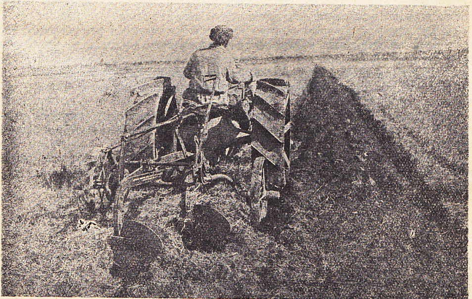
Трактор т-ва «Хакас».

Таков в кратких беглых очертах этот интересный, богатый хозяйственными и культурными возможностями край, в котором год от году укрепляющиеся новые формы жизни, рожденные Октябрем, еще мешаются с умирающими пережитками глубокой древности.