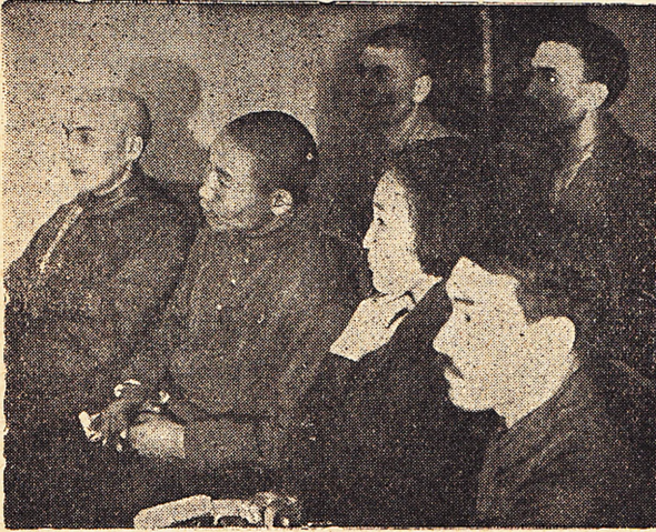
Просвещенцы нацмены—делегаты с'езда.

актив. При развитии и осуществлении союзной демократии этот актив ежегодно об- новляется. Большинство из него приходит впервые на союзную работу и требует систе- матической помощи. Помощь эта должна оказываться путем умелого и живого руко- водства со стороны высших союзных организаций. Особенно плохо обстоит с работой по обслуживанию отдельных групп работников. Выступающие в прениях по отчету